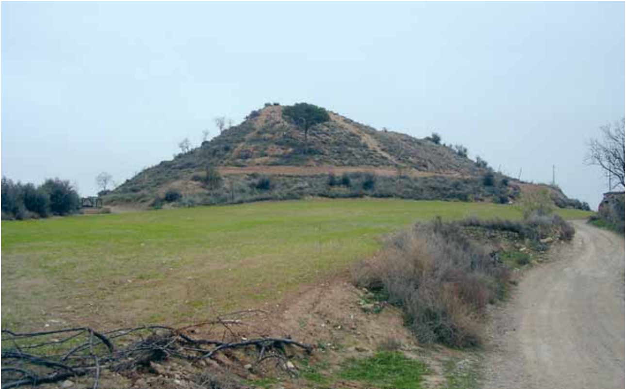
Fig. 4 Un dels nou tossals, al marge de la serra de sant Eloi, que hi havia a l'antic terme del Mor.

per tant, han tingut senyors, batlles i rectors diferents, així com podien plantar forques. Fins al punt que, el 19 de maig de 1597 (apartat 1 article 17), “se posa una fita per los ministres del duch en la dita partida aygua vessant envers Vilagrassa, ab assistència y presència dels mostaçaffs, syndics, prohoms y scrivà de la casa del consell de Tàrrega, [ja que] la dita fita dividia lo dit terme del Mor y partida del aygua vessant y lo terme de Tàrrega”. En concret, la disputa estava (apartat 2 article 5) en la “partida del Ferrugat és en la més baix de dit terme del aygua vessant del Mor, y affronte entre altras affrontacions ab lo reguer corrible, per lo qual discorre la aygua des del terme de Tàrrega al de Anglesola, dividint en lo curs los térmens de Vilagrassa y del Mor”, i així ho demostraven (apartat 2 articles 7 i 8) antigues forques que “per ser de fusta se vingueren a pudrir” i “ab fitas molt vellas y antigues que denotan la divisió y separació”. 12