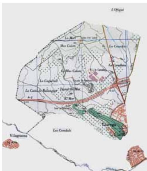
Fig. 1 Mapa de l'actual partida del Mor, en el municipi de Tàrrega, amb la inclusió de les partides veïnes de la Canaleta i el Camí de Balaguer-Cagarrell.

comtat d'Osona, que equivaldria a l'antic bisbat de Vic. 5 I s'esmenta, clarament, el límit per la banda est, concretament, el camí públic que va de Tàrrega a Lleida en el " fossam Maurelli et per rivum qui dicitur Arenarum ". La paraula llatina "fossa, -ae" es pot traduir per límit o terme, en aquest cas relacionable amb el Mor, en concret, pel lloc per on passa el riu d'Ondara. 6 També s'esmenta, com afrontació, el lloc de " Mauro " o " Mauri ", segons la declinació. També, en data indeterminada a finals del segle XI, on es parla dels límits del comtat de Berga, s'esmenta que prop d'Ofegat hi passa un camí que anava des de la " Corbela " fins al " pugio de Mor ", és a dir, de l'actual partida de la Corbella (antic municipi del Talladell, ara de Tàrrega) fins al puig del Mor. 7