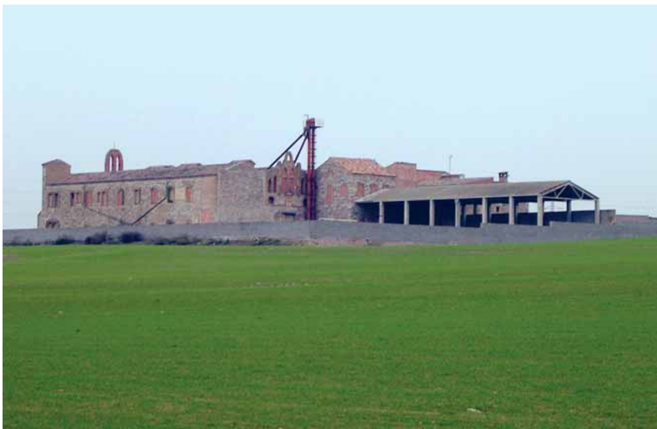
Fig. 7 Mas d'en Colom, seu d'un monestir cistercenc entre 1905 i 1920.

sant Eloi); el 6 de juliol de 1393 "l'home de confiança del rei a Tàrraga" (el batlle?), Joan Aguiló, rep una carta del rei, datada al mes de febrer del mateix any, per la qual ordena al veguer de Tàrraga que doni possessió a Aguiló del castell del Mor i altres termes de la vegueria, i l'endemà 7 de juliol de 1393 planten les forques com a senyal de jurisdicció; o la manifestació de la reina Elionor de Sicília contra Francesc d'Erill i d'Anglesola pels excessos comesos en les aigües del Mor. 34 Aquests problemes deriven fins a inicis del segle XIX. Vegeu com entre 1831-