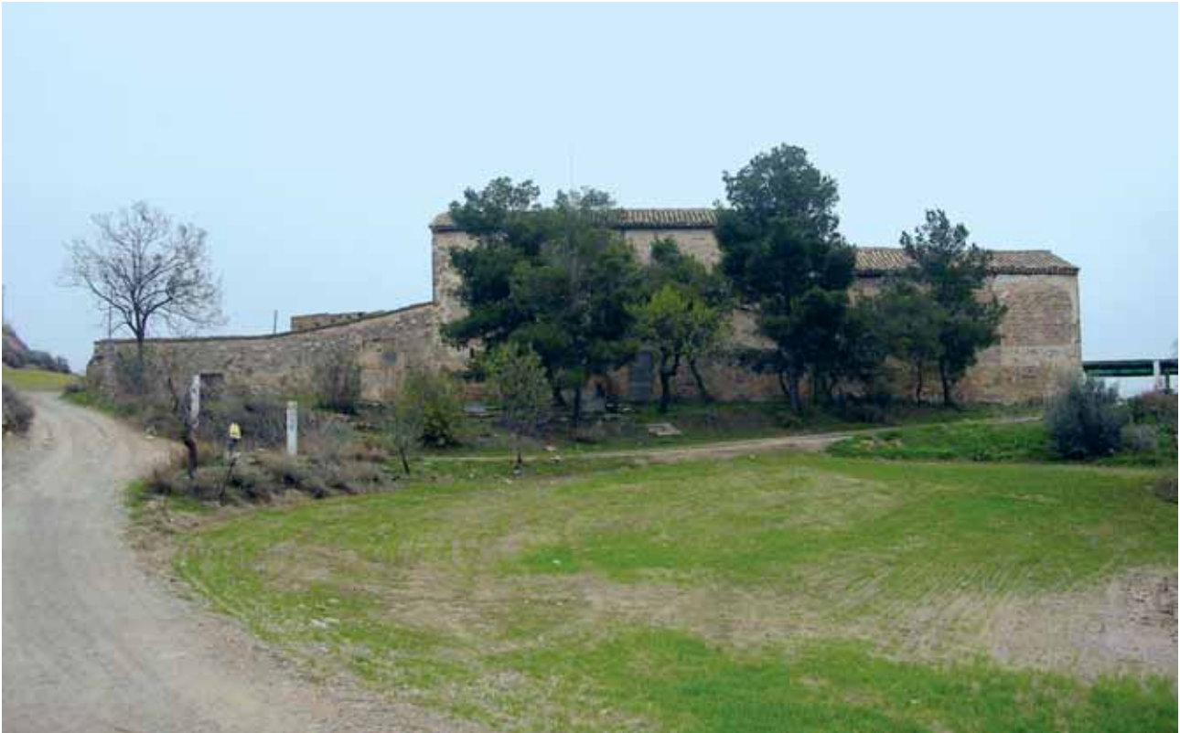
Fig. 5. Torre Morlans , casa ubicada on hi havia l'antic Mas Guadalons, documentat des del 1322.

tència del plet seguit per Ramon d'Anglesola, senyor de Bellpuig i veí de Tarrega, i els síndics i procuradors de la vila de Tarrega, contra els propietaris de les terres del castell del Mor. 27 bis Segons Bach, en el segle XIV "hi ha documents que acrediten cert domini" del batlle de Vilagrassa sobre una part del terme del Mor, on s'havien format les quadres d'en Lluçà, d'en Solsona i de Rubió de Fluvià. 28 El 1448 la reina Maria, muller d'Alfons V, atorgava sentència amb la qual imposava silenci a Ramon de Cardona sobre la jurisdicció al terme del Mor, en la vessant de l'aigua cap al sud, i manava al batlle de Vilagrassa que conservés el dret d'exercir jurisdicció civil i criminal en la part del terme esmentada. 29 El 1594 el fiscal realitza una sèrie d'actuacions en nom del lloc del Mor contra Antoni de Cardona-Anglesola. 30 El 1607 el fiscal realitza altres actuacions sobre el reconeixement del castell del Mor contra el mateix, ara esmentat com a duc de Sessa. 31 El 19 de desembre de 1618 Lluís