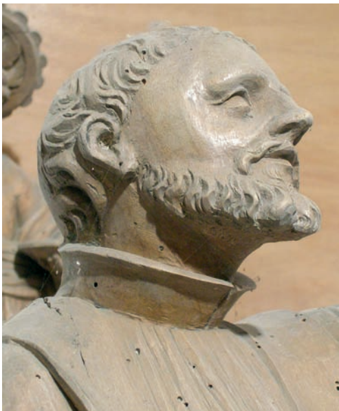
Fig. 47. Escultor desconegut, detall del sant titular, retaule de sant Francesc Xavier, 1720-1730, església parroquial, Lloberola.