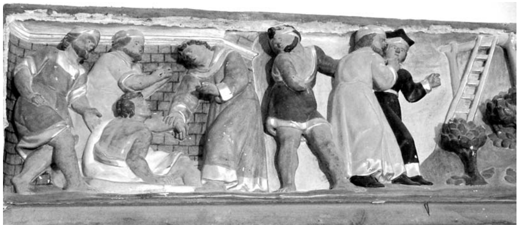
Fig. 4. Josep Ribera (?), escena de martiri, retaule indeterminat, circa 1650, església de Santa Maria, Guissona.