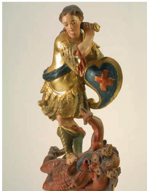
Fig. 44. Fèlix Ribes, Sant Miquel matant el dimoni, antic retaule de la capella de la Paeria, 1705, Museu Comarcal, Cervera.

Pel que fa a l'escultura, l'obra trenca la típica construcció en retícula, i s'hi noten clares influències de models d'Agustí Pujol, tal com podem veure en l'escena de l'Anunciació, que recorda la composició del retaule de Martorell. El retaule és d'una qualitat destacable,