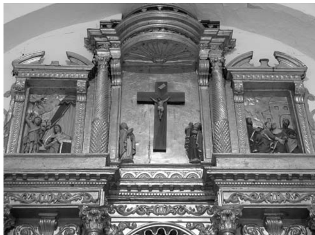
Fig. 6. Escultor i pintor desconeguts, retaule del Roser, 1653, església parroquial, Lloberola.