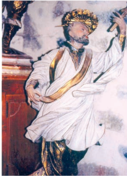
Fig. 46. Josep Sunyer Raurell, sant Francesc Xavier, sagristia, església parroquial, Ur. Reformes de l'altar, sagristia.