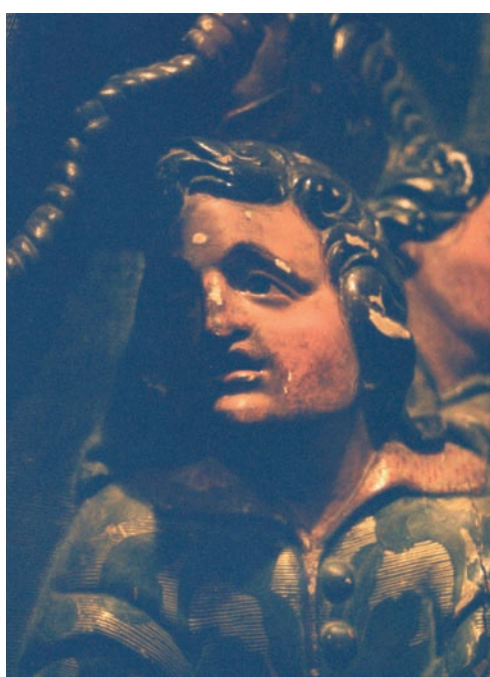
Fig. 14. Joan Grau, Rostre d'un ajudant de sant Eloi, detall de Sant Eloi ferrant un cavall endemniat, 1627 (?), Museu Comarcal, Manresa.