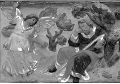
Fig. 1. Josep Ribera (?), Aparició de l'àngel a sant Josep, antic retaule de sant Josep?, 1650, església de Santa Maria, Guissona.