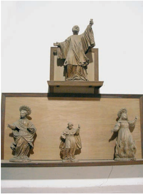
Fig. 45. Escultor desconegut, retaule de sant Francesc Xavier, 1720-1730, església parroquial, Lloberola.