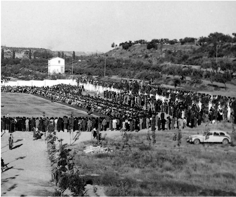
Vista del camp de futbol de Tàrraga i en segon terme l'extrem est del Maset, on se situa la necròpolis de Roquetes, durant un partit de futbol celebrat el setembre de 1948.