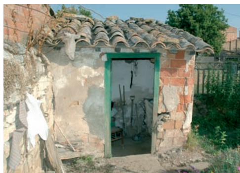
Cabana de l'hort de la Maria Cos. Estiu del 2004.

És fàcil trobar en cada un dels horts un seguit de senzilles construccions que actuen de coberts o petites cabanes, que tenen una funció de suport de les activitats agrícoles com l'emmagatzematge d'eines i productes resultats del treball o simplement com a lloc de descans