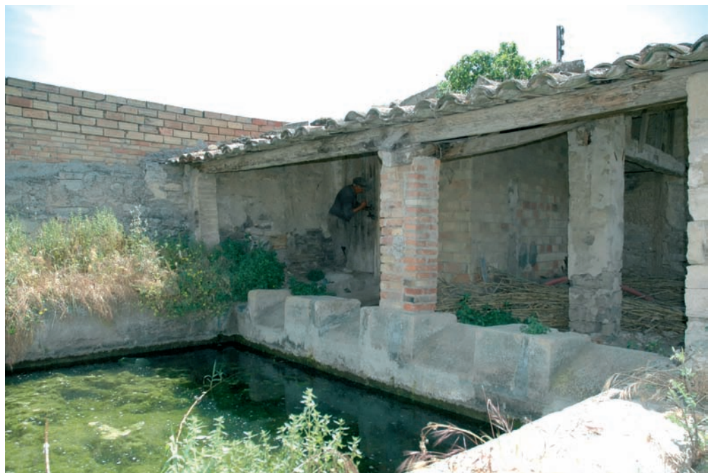
Antiga sínia amb bassa i safarejos del Callet.

Un d'aquests sistemes d'aprofitament d'aigua subterrània que existí en alguna de les parcel·les foren les sínies, en funcionament fins al segon quart del segle passat. La sínia era un enginy consistent en una roda horitzontal accionada per una animal de càrrega o tir que