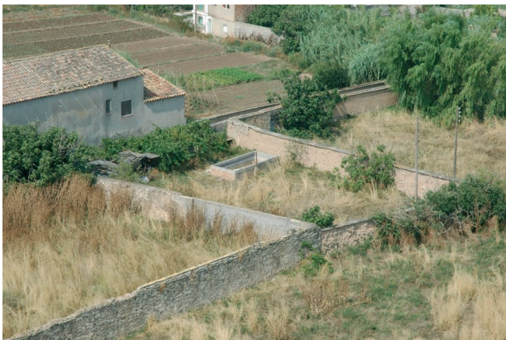
Horts sense conrear. Estiu del 2004.

El darrer aspecte que cal assenyalar, i que connecta amb aquestes darreres reflexions, ha estat i és el creixement urbanístic de la ciutat, del qual ja n'hem fet esment. La desaparició dels horts cal interpretar-la com un procés natural del creixement urbà de la població, però aquesta realitat no ens ha de portar a aferrar-nos a la creença que el desenvolupament s'ha de bastir a sobre de les runes de tot allò que forma el llegat del nos-