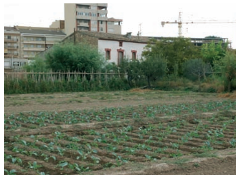
Hort de ca l'Estrada. Estiu del 2004. Museu Comarcal de l'Urgell-Tàrraga.