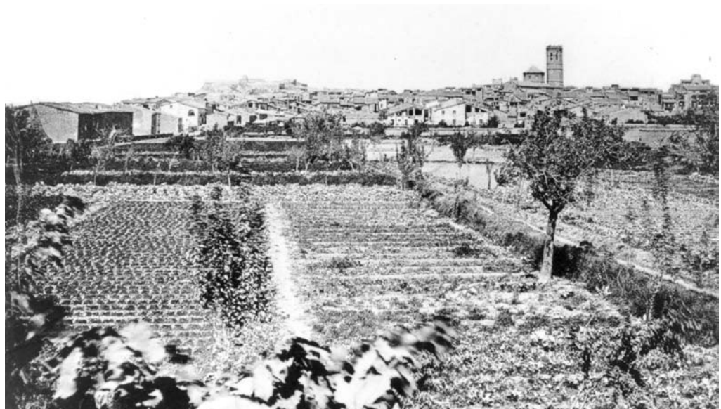
Panoràmica de l'hort de la Trilla i horts del Callet amb Tàrrega al fons. Any 1880.

L'hort de la Trilla havia estat un dels horts més importants de la zona, quant a la seva extensió i al volum de la seva producció. Aquesta finca s'estenia més enllà de l'actual avinguda de Tarragona i traçava una línia de