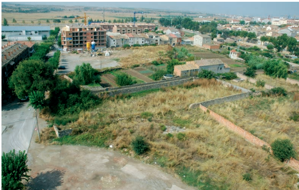
Vista des de l'edifici La Plana de l'hort del Barceloní, hort de la Trilla i horts del Callet. Estiu del 2004.