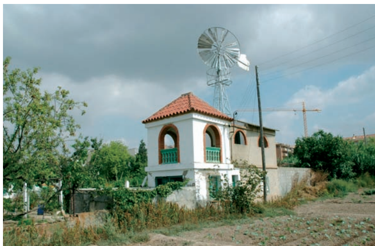
Molí de vent de tipus americà de l'hort de ca l'Anguera. Estiu del 2004.