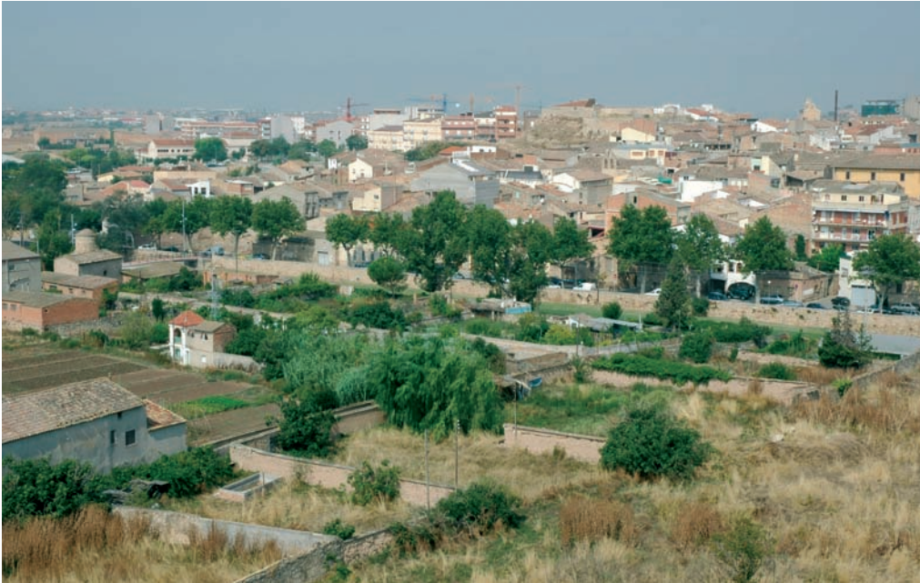
Horts de la partida del Callet. Zona nord. Estiu del 2004.