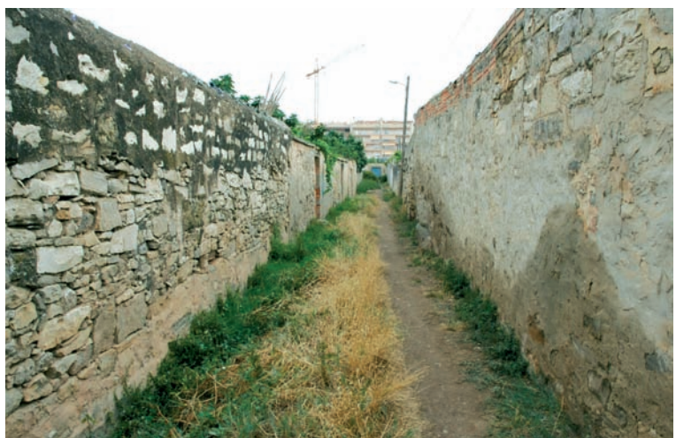
Tram oest del Callet, des de la banda de ponent. Estiu del 2004.

o reunió familiar. Aquestes cabanes sovint formen part dels murs de tanca que encerclen l'hort i el separen de les parcel·les veïnes i de l'exterior. Precisament aquest exterior està travessat per una xarxa de camins, anomenat Callet, que atorguen al conjunt dels horts una part important de la seva singularitat. El Callet