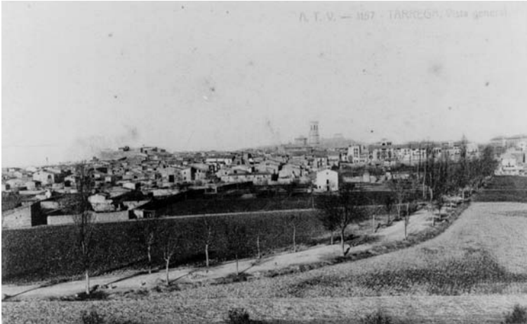
Postal de Tàrrega amb l'hort del Barceloní al centre de la imatge. Primer terç del segle XX.