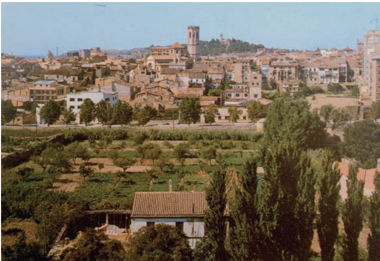
Hort de la Trilla i horts del Callet des del sud-oest. En primer terme el Raval de Sant Agustí. Primer terç del segle XX. Ref: 13.922

del qual anava dirigida al mercat. En canvi, els trossos més petits representaven un espai on es realitzaven, conjuntament, activitats de caire lúdic i de treball horticola els resultats del qual s'orientaven a l'autoconsum familiar. La producció de l'hort, degut a la seva poca extensió, no era suficient, doncs, per garantir un mitjà de vida als membres del grup. 13 En ambdós casos, però, tant els horts "grans" com els "familiars" aconsegueixen una funció econòmica que se sosté mitjançant el treball col·lectiu, i per tant representen uns terrenys com-