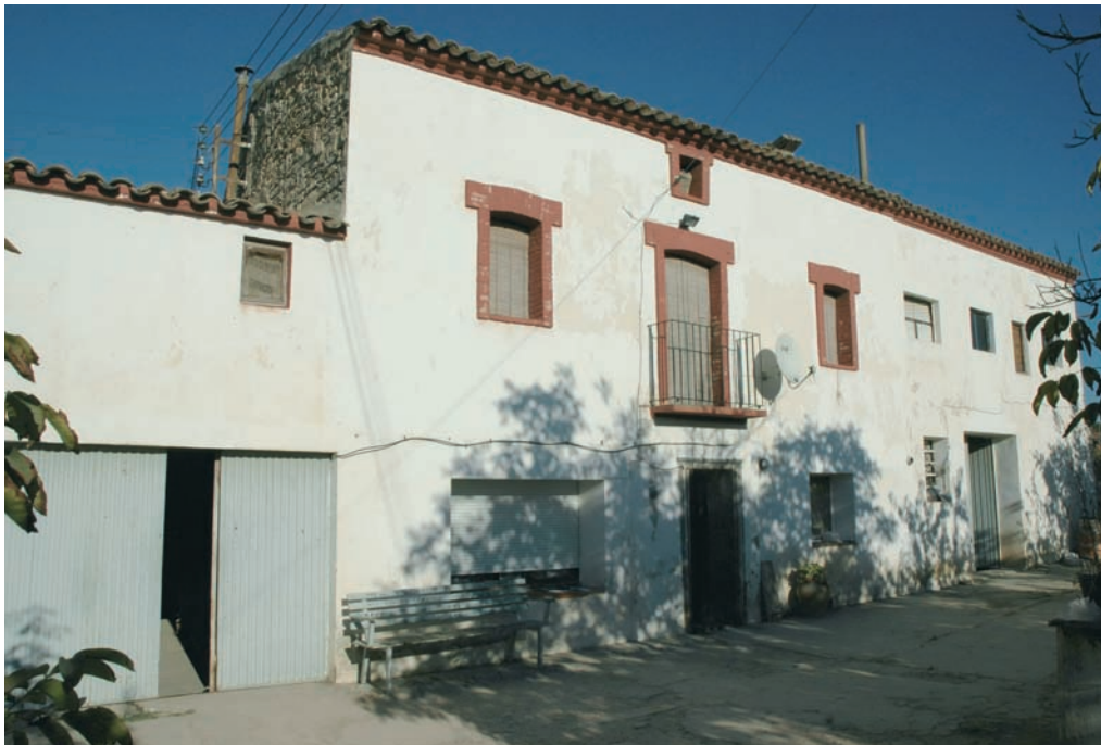
Ca l'Estrada. Estiu del 2004.

d'aigua de reg els conreus de l'hort i per satisfer algunes necessitats de la vida quotidiana. El pis superior acull la cuina, la sala i les habitacions dels diferents membres familiars, era per tant el lloc amb més intensitat de les relacions socials fora de l'àmbit de treball. Finalment, es trobaria un tercer pis o nivell ocupat per les golfes, un espai destinat a la cria d'animals per al consum i com a rebost de determinats productes sotmesos a diferents processos de conservació. La masia estava envoltada dels seus conreus d'arbres fruiters i hortalisses. Tota aquesta organització de l'espai portava aparellada una certa divisió del treball en base a criteris de gènere i d'edat, però el desenvolupament d'aquest aspecte va més enllà dels objectius d'aquest article. La masia de l'hort del Barceloní estigué habitada fins la passada dècada dels anys noranta.