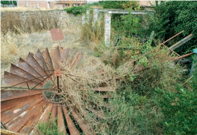
Molí de vent caigut de l'hort de ca l'Esqué. Estiu del 2004.