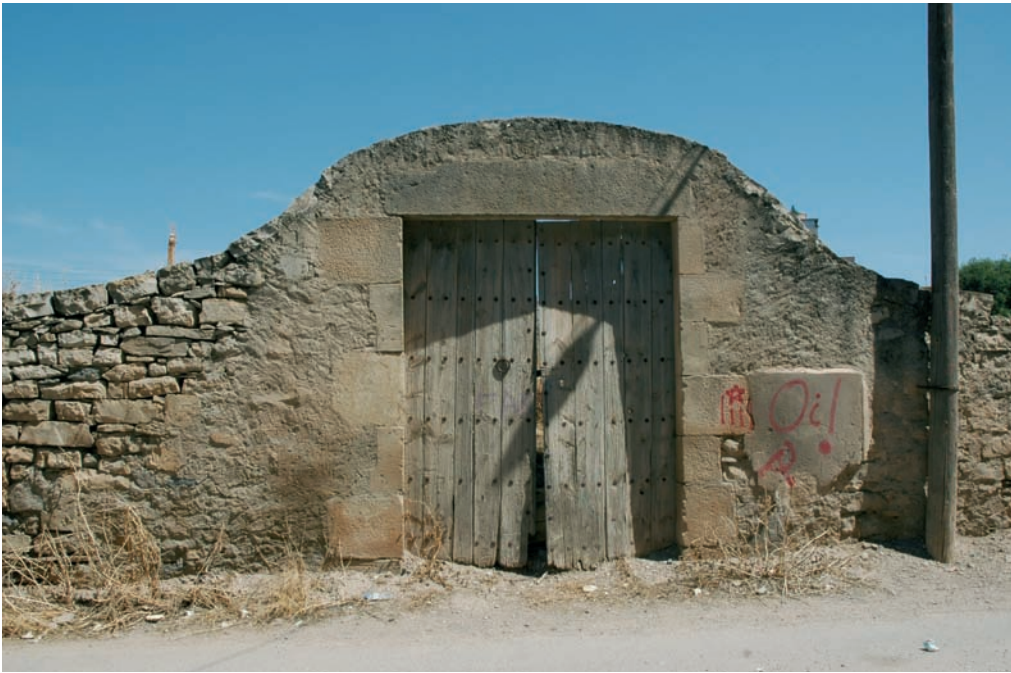
Porta de l'hort de la Trilla del Raval de Sant Agustí. Estiu del 2004.