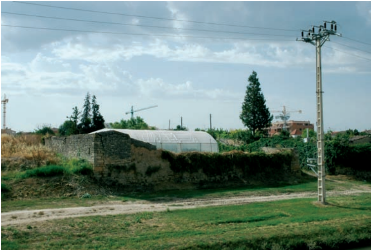
Hort de cal Pont des de la muralla. Estiu del 2004.

que han estat localitzats, n'existeixen alguns més, pràcticament un a cada hort, que ja han caigut en desús i resten completament abandonats. Aquest fet ressalta l'existència, sota la zona que ocupa avui l'indret dels horts, d'una bossa o mina d'aigua prou considerable, probablement nodrint cada un dels pous, que en l'antigor va satisfer part de les necessitats d'aigua per al consum humà i per al reg de la població de Tàrrrega. En aquest sentit, és rellevant remarcar que enterrades davall dels terrenys d'algun d'aquests horts es trobarien les restes de la famosa Font dels Romans, que segons la historiografia local es remuntaria a l'època romana, d'on rebria el nom. Amb tot, és plausible creure que antigament existí en l'actual espai dels horts una font abundant i generosa, emmarcada en algun tipus d'estructura arquitectònica, que proveïa d'aigua a