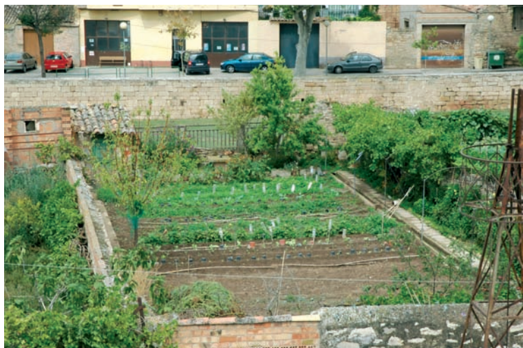
Hort de Maria Cos de cal Pelat. Al fons el Reguer i la muralla del segle XIX. Estiu del 2004.