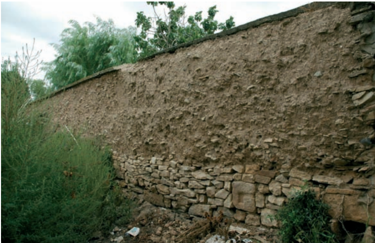
Paret de tàpia de l'hort de ca l'Estrada. Estiu del 2004.