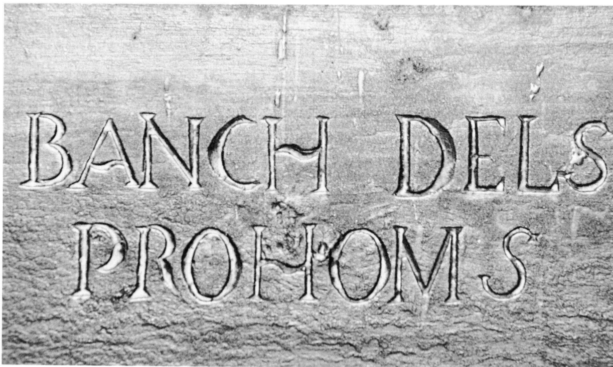
Detall del banc dels prohoms a l'església parroquial d'Anglesola. Datat el 1826. (Fotografia: Albert Pont).

persona alfabetitzada per a poder entendre de nombres, papers i activitats administratives. A més, recordem que tots els prohoms havien de ser secretaris en un moment determinat i que, només per això, necessitaven saber de lletra , com es deia abans, per a poder escriure les actes.