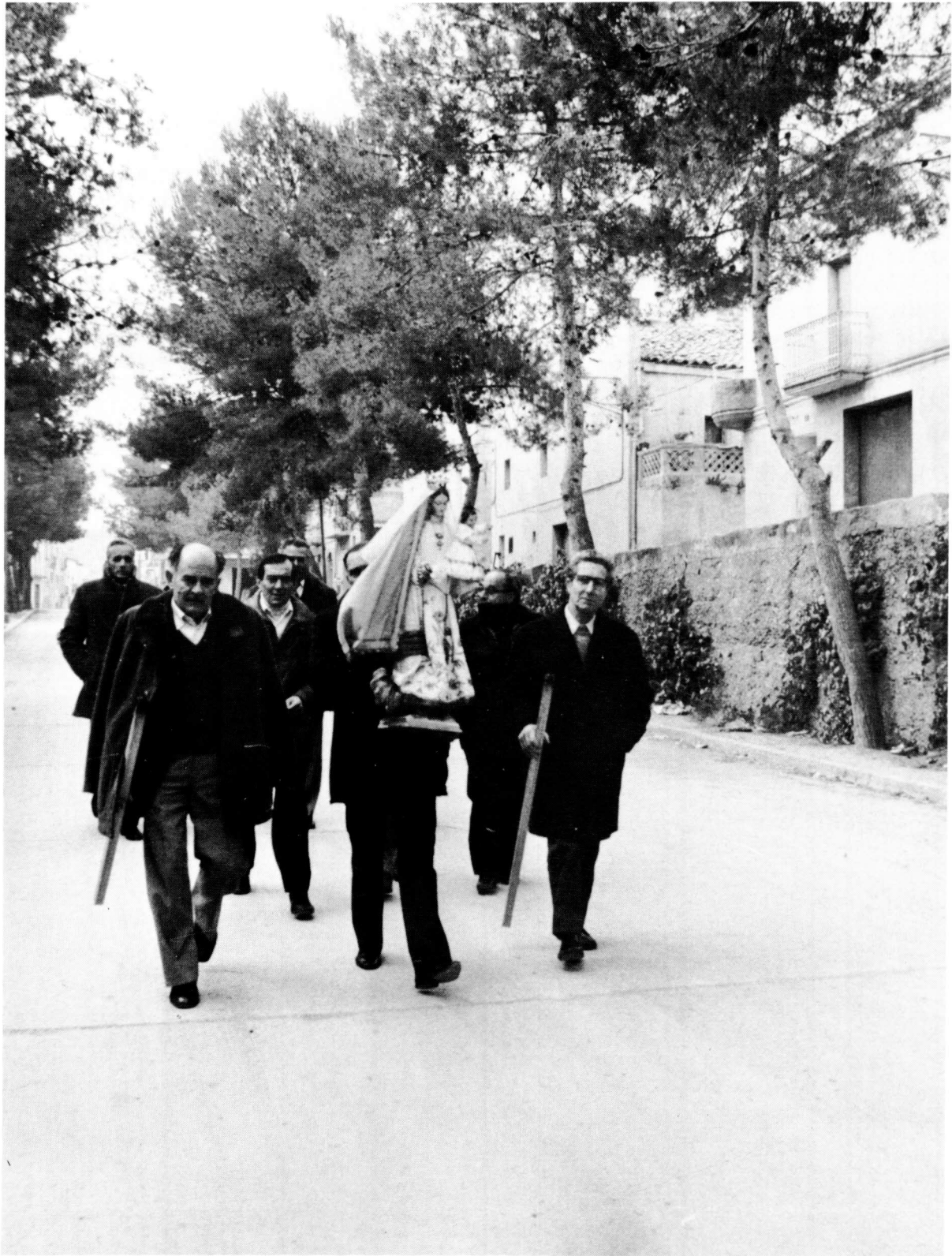
Trasllat de la Mare de Déu del Roser (o dels Prohoms) d'Anglesola. Aquest trasllat es fa cada any durant el mes de febrer, d'una casa d'un prohoms a la d'un altre, el qual la guardarà fins l'any següent. (Fotografia: Albert Pont, 1982).