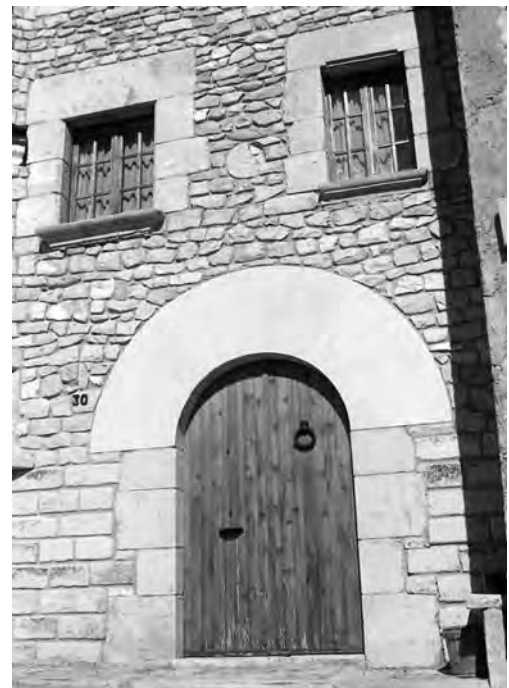
Disc d'estela col·locat com a peça ornamental a la façana d'una casa particular a Sant Martí de Maldà

Cada cop sembla més evident que qualsevol aproximació a un tema de patrimoni, sia per la seva conservació o protecció, sia per al seu estudi, no es pot realitzar des d'una sola perspectiva investigadora. Cada cop s'està tendint, en major o menor grau als estudis interdisciplinars; més quan l'objectiu de les diferents especialitzacions és el mateix: la forma de vida, costums, creences, història social, etnografia, evolució, etc. que en el fons volen dir conèixer