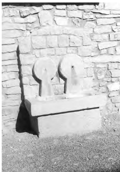
Dues esteles de Ciutadilla col·locades com a ornament d'una font pública.

Constatem també la presència de dues esteles a Maldà. 46 La primera, de tipus antropomorf, està col·locada sobre un mur de contenció al carrer del Portal, davant d'un dels antics portals d'entrada al poble. I la segona, que es trogué d'un dels murs del cementiri actual on