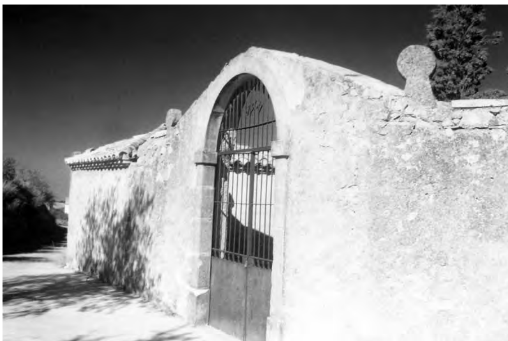
Vista de la façana principal del cementiri de Nalec, amb dues esteles discoïdals a sobre de la tanca com a elements de senyalització funerària.

A Sant Martí de Maldà hom té notícia de la troballa de sis esteles discoïdals en diversos llocs de la població, 42 tot i que sembla que procedirien del primitiu fossar parroquial. 43 En l'actualitat quasi totes elles es troben en mans particulars i dues d'elles han estat portades fora del poble, sense que es conegui el destí que se'ls ha donat, encara que es coneix el lloc on es troben. Entre les que es conserven al poble cal esmentar la ubicació d'una d'elles col·locada fa poc temps en una façana d'una casa com a element decoratiu. Sembla però que hi ha la pretensió de recuperar-les totes i guardar-les en un museu local de futura creació.