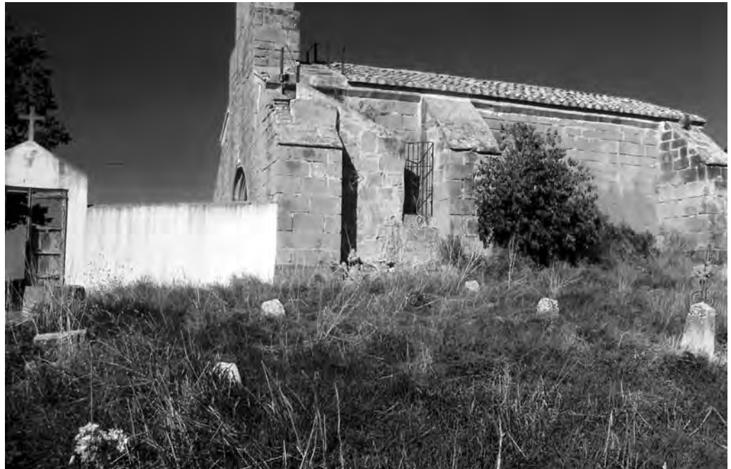
Vista del cementiri de Castellnou d'Ossó amb les esteles discoïdals conservades aparentment in situ.

estava encastada, es guarda a l'Ajuntament. Utilitzades com a elements decoratius dels murs de delimitació de la plaça de l'Església de Claravalls trobem dues esteles, una d'elles de tipus antropomorf. Procedeixen de l'antic fossar situat als voltants de l'església i creiem que foren recuperades quan s'adequà aquest espai com a plaça. Sembla que fa uns anys hi havia una peça més en aquesta plaça 47 , la qual no hem pogut localitzar malgrat les nostres gestions.