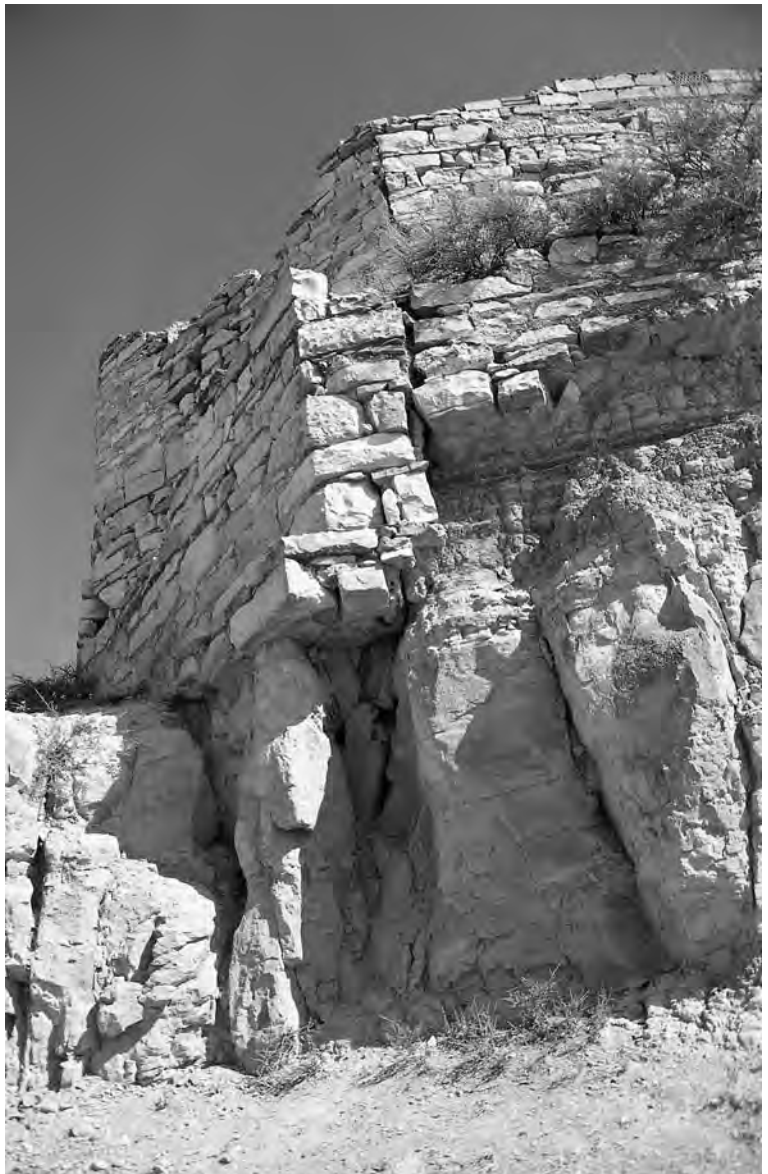
Fenomen de la diàclasi que afecta les estructures conservades del castell de Tàrrega.