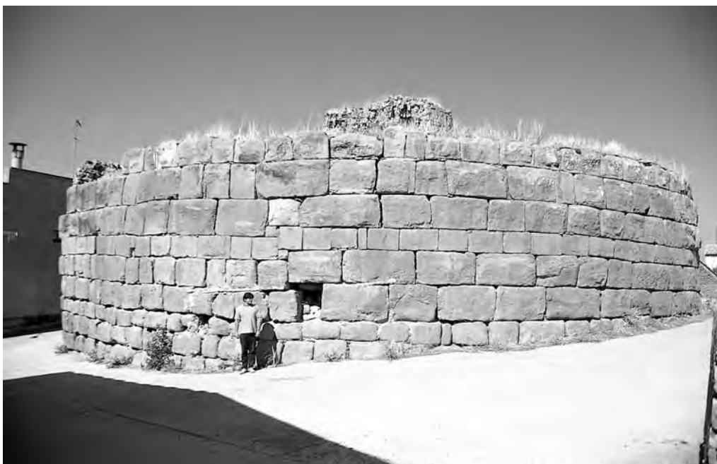
Torre romana de Castellnou d'Ossó, vista des de l'est.

seu diàmetre màxim és de vora 24 metres. L'alçada visible conservada oscil·la entre els 4,20 i 5,50 metres, tot i que hi ha més filades soterrades que poden donar una alçada total superior a la que s'observa en l'actualitat. La torre es troba construïda amb grans blocs de pedra sorrenca tallats de forma regular. Bona part dels carreus són encoixinats, d'altres són de parament llis i repicats per la seva cara externa. El mur que delimita el recinte es troba format per un doble parament amb un farciment interior de morter de calç que actua de lligam de l'obra, amb una amplada total de 2,5 metres. En les filades superiors el farciment intern del mur sembla ser de terra i pedra petita, però aquest detall només es constata en l'extrem sud-est del mur, secció feta per l'arrasament d'aquest sector del recinte durant el present segle. A la zona central de l'interior del recinte, a la vora de la desapareguda paret sud-sud-oest, s'aixecà en època medieval una torre de guaita circular, de 4,25 metres de radi, de la qual només es conserva una alçada de