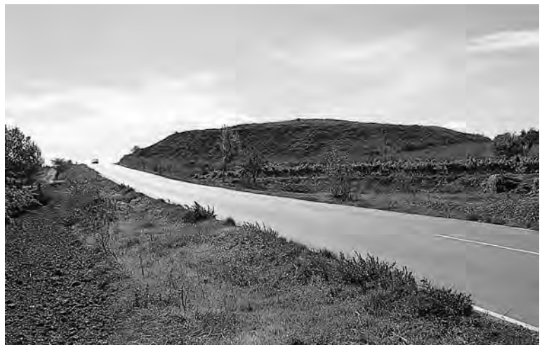
Vista del tossal Rodó de Verdú, afectat per la carretera Comarcal 240

Les obres al casc urbà poden tenir més incidència en la destrucció de restes arqueològiques del que sembla. En el cas dels nuclis ur-