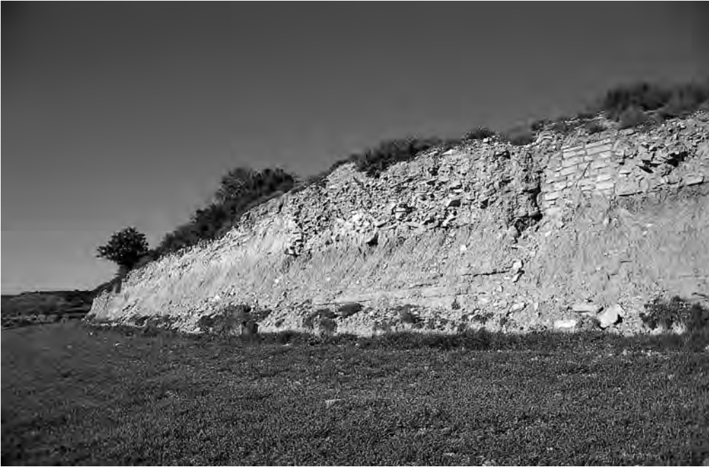
Vessant sud del jaciment ibèric del Pla de les Tenalles de la Mora, afectat moderadament per l'abancament agrícola del tossal.

arqueològic i, llevat d'algunes excepcions, no es va poder practicar cap excavació arqueològica de salvament. Pel que fa al període anterior a la creació del Servei d'Arqueologia, només en el cas de la vil·la romana del Reguer, 4 de Puigverd d'Agramunt, de la necròpolis d'Almenara 5 i d'alguns altres casos aïllats es van poder realitzar excavacions arqueològiques de curta durada i amb unes condicions precàries.