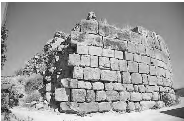
Zona sud- sud-oest de la torre afectada per les obres urbanístiques.