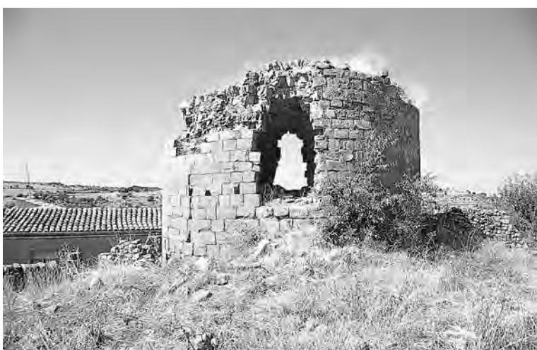
Restes de la torre de guaita medieval aixecada a l'interior de la torre romana de Castellnou.

La nostra proposta té l'objectiu d'establir les premisses per a un estudi del conjunt monumental, per la realització d'una consolidació i restauració de les restes i esbossar un projecte de promoció i divulgació d'aquest monument com a pol d'atracció de turisme rural i cultural.