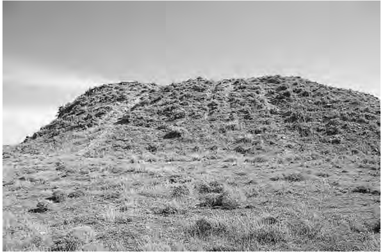
Roderes de vehicles tot terreny que erosionen el vessant oest del tossal del Mor de Tàrrega.

Tots aquests factors, molt sovint interrelacionats, provoquen la progressiva destrucció del patrimoni arqueològic de la comarca, un fet davant del qual poc a poc es va avançant en l'intent de trobar vies de solució després d'anys sense gairebé cap mena de protecció.