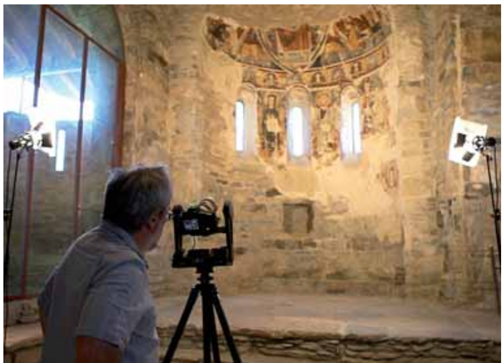
Il·lustració 4. Utilització d'un sistema robotitzat GigapanPro en la captura d'una gigafoto de les pintures murals romàniques de l'església de Sant Vicenç d'Estamariu.

L'arribada de les càmeres digitals i el processat de les imatges ha permès disposar de sistemes de captura i visualització de resolució virtualment infinita. En l'actualitat, es considera el límit de la mida d'un sol fitxer d'imatge digital en 300.000 × 300.000 px (format PSB). Però la possibilitat d'organitzar