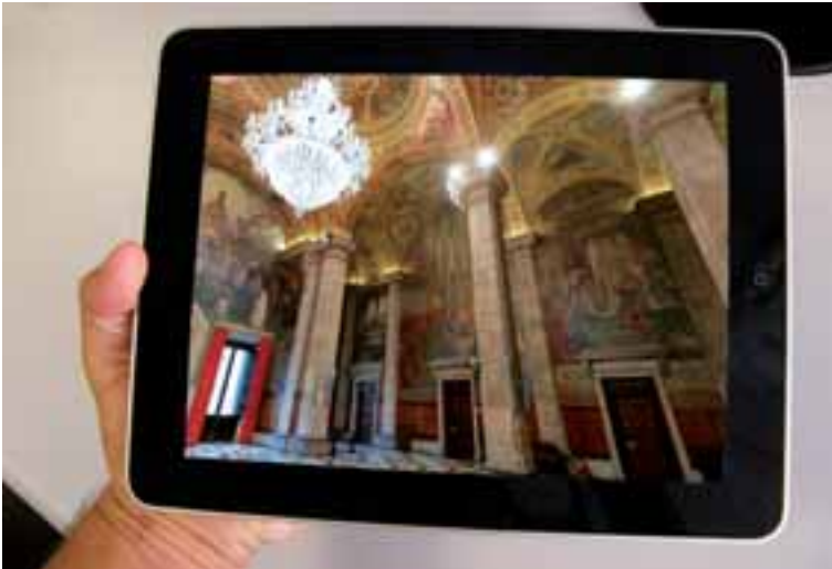
Il·lustració 6. L'iPad permet explorar de manera interactiva panoràmiques de 360°. En aquesta imatge, les pintures murals del Saló Sant Jordi de la Generalitat de Catalunya.

b) A la imatge resultant, habitualment de grans dimensions, cal fer-li una correcció de geometria i color.