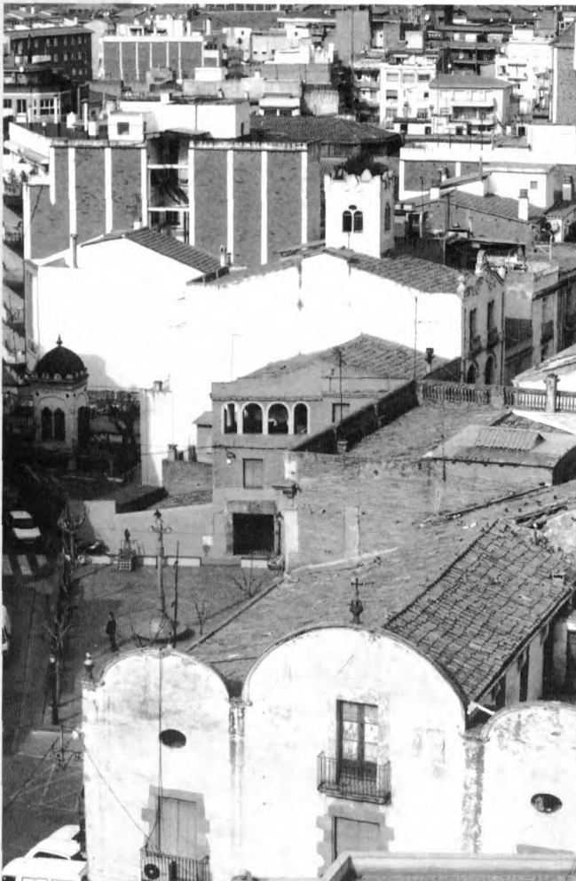
Vista de Can Roca i porta del Palau a la plaça de la Creu