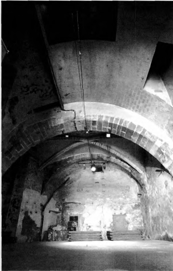
Celler del Palau Requesens

pondència que s'estableix entre Albert Combelles i Ponsich, al qual podríem designar com sotsadministrador de l'administrador general del marquès de Vilafranca y los Vélez, Antoni Cabrer i el mateix marquès. 7