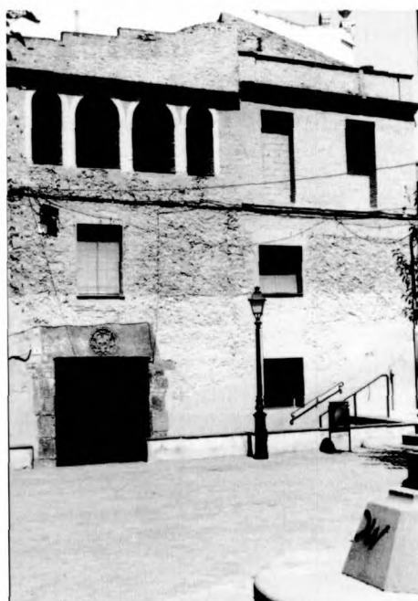
Una porta d'entrada al Palau

Avui l'edifici construït sobre l'antic palau és propietat municipal. De les construccions primitives sols es conserva el celler, la porta que podria ser d'accés a la capella i una petita part del jardí que donava a la façana del palau, dels escuts d'armes del Requesens que l'adornaven se'n conserva un que està depositat al Museu Municipal, i un altre encara es pot veure molt malmès sobre la porta de l'entrada de la casa situada davant de la creu de terme.