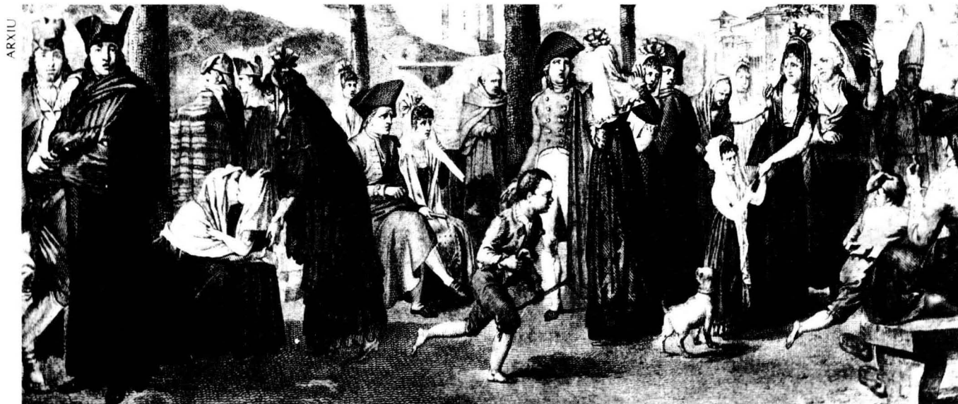
A les burgeses no els calien ni dites ni rodes de la fortuna per trobar marit.