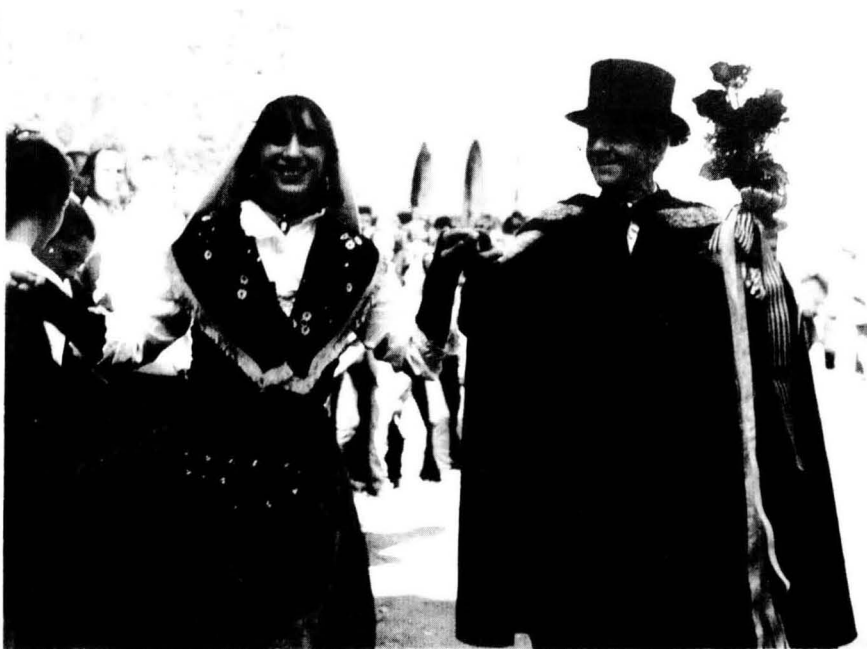
La dansa de Falgars, a la Pobla, servia per trobar parella i casar-se abans d'un any.

Al Berguedà —en tenim constància a Castellar de N'Hug, Gósol i Merola— era costum que la fadrinalla entrés a la cambra dels nuvis, quan aquests ja eren al llit, i els servissin unes tasses de brou. Les tasses les posaven dintre d'una gran caldera i l'entraven a la cambra sostenint-la dos nois amb un samaler. El jovent es menjava les gallines utilitzades per fer el brou en una taula parada a la mateixa habitació.