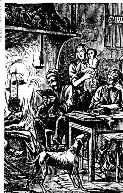
Falta informació per aprofundir en la història de la dona.

Quan volem anar més enrera en el temps ens cal recórrer a altres fonts: diaris i dietaris de pagesos, llibres de viatges, festes i tradicions, i sobretot documentació notarial com ara testaments, inventaris "post mortem", registres de propietat, contractes, capítols matrimonials, etc. Pels estudis de demografia podem recórrer als arxius parroquials amb els seus registres de naixements, noces, bateigs, defuncions, etc. També ens poden ser