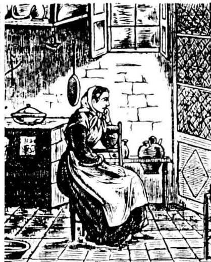
L'educació femenina vol aconseguir dones treballadores, silencioses, humils...

ca y sagrada del Paradís de la Iglesia", Girona 1762. El tema principal són les relacions matrimonials, les paterno-filials, el sagrament del matrimoni, les relacions sexuals, els delictes d'avortament i homicidi, etc. També l'obra d'Antoni Arbiol: "Tractat sobre la família" del 1769 sobre les obligacions mútues dels esposos, educació dels fills, etc." 15