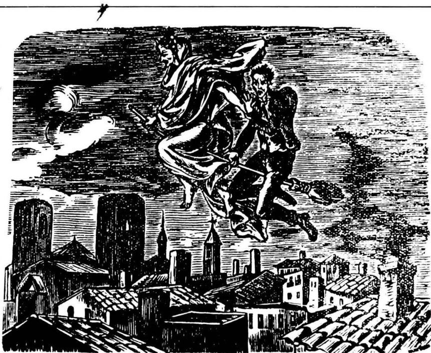
La bruixeria va florir especialment els S.XVII-XVIII.

la vila per la seva moralitat, i calgué pensar en una altra solució"; aquesta fou el trasllat a Sant Joan.