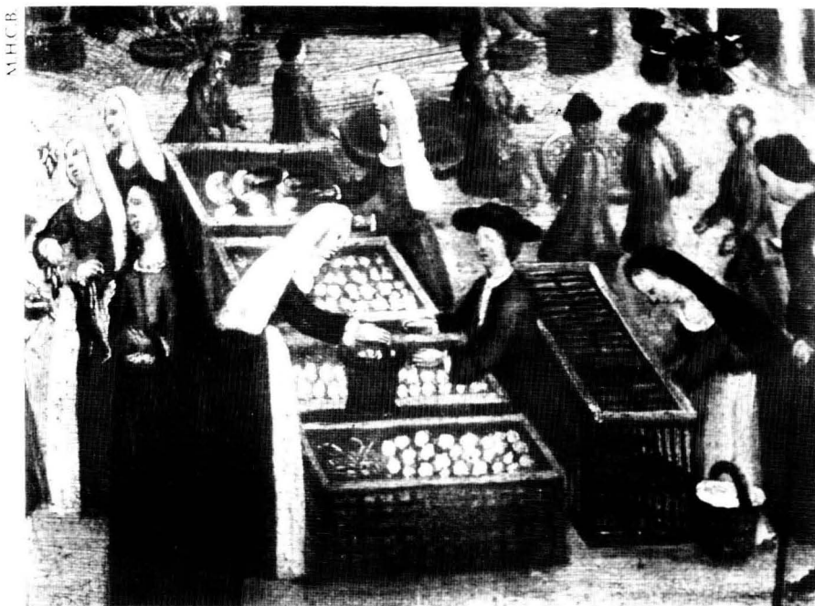
Parades d'ous i aviram, al Born de Barcelona el S.XVIII, amb dones comprant i venent.