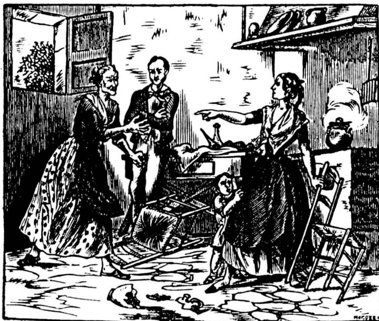
La violència i les discussions són presents a la vida familiar.

na fou objecte de la violència del marit i no solament en casos d'adulteri. 3 En una societat en què la llei legitimava aquesta actuació és fàcil d'imaginar la situació d'opressió que varen patir moltes dones. En molts dels processos de separació conjugal presentats davant la Cúria del Bisbat de Barcelona (de 1565 a 1650 d'un total de 152 processos de separació matrimonial, 14 foren sol·licitats per homes i 138 per dones) 4 es veu clarament que, entre les moltes raons que al·leguen les dones per tal d'aconseguir l'anul·lació del matrimoni, una de freqüent és la violència del marit. I és que la dona que rebia maltractes sense "justificació" podia abandonar el marit i aquest era obligat a mantenir-la.