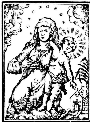
Gravat de l'any 1812 dels Goigs de Santa Maria de Jus d'Avià, anomenada Ntra. Sra. de la Llet.

Als nuvis se'ls donava de beure el brou amb culleres planes o foradades de manera que no el podien tastar. 2 Aquesta broma durava qui sap l'estona.