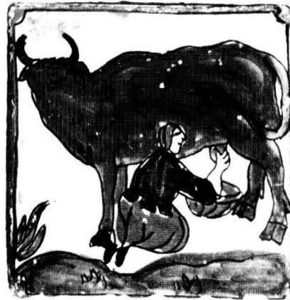
El treball femení és imprescindible a pagès. (Platò S.XVII-XVIII).

La importància del treball femení a pagès, especialment a certes èpoques de l'any, es demostraria segons Montserrat Carbonell 6 "en la reducció de concepcions a la tardor o a principis de l'hivern, quan les dones eren cridades a la verema i a la collita de les olives; o també, en la reducció de naixements nou mesos després, quan el moment de segar i batre el cereal reclamava de nou els braços de les dones."