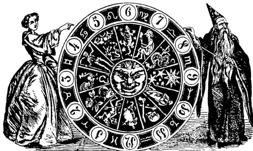
Roda de la Fortuna, molt consultada la nit de Sant Joan per les fadrines que escondriyaven el futur amorós.