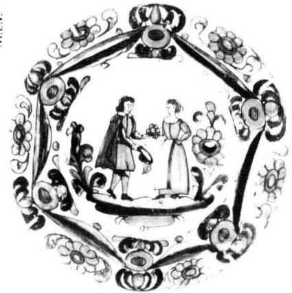
Parella, segons un plat català del s.XVIII al Museu Episcopal de Vic.

conseqüència de la minva de la mortalitat femenina. L'home, molt més que la dona, mostrava la tendència a tornar-se a casar sobretot si tenia fills al seu càrrec, i ho feia de pressa cosa que no feien les dones perquè havien de respectar l'any de plor.