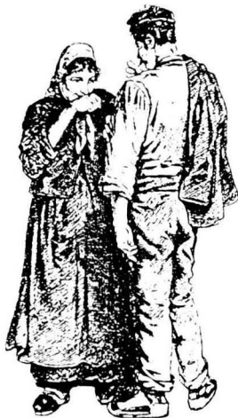
La dona casada perd el seu cognom i de vídua usa els del marit.

plor" que la impossibilitava de contraure matrimoni d'un any (precaució existent ja des del Dret Romà) per tal d'evitar problemes en la determinació de la paternitat d'uns possibles fills nascuts després de la mort del marit.