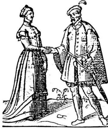
L'estatus socio-econòmic determinava la nupcialitat.

A la primera meitat del s. XVIII l'edat de matrimoni continuava essent elevada a Catalunya, el 22% de les dones es casen entre els 14 i 24 anys i el 77,8% es casa amb més de 25 anys. Així a la comarca del Berguedà trobem que: