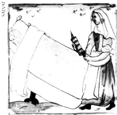
Una professió gairebé exclusiva de la dona: la llevadora. (Taula S.XVIII).

Una ocupació femenina que va tenir una enorme importància fins a èpoques força recents fou la de dida, l'al·letament dels fills d'altres dones. Les famílies benestants solien llogar dides a casa seva, l'altra gent solia enviar els seus fills a criar per una dida de pagès o de les classes populars urbanes. Era una relació purament econòmica que contribuïa d'una manera important a l'economia domèstica, alhora que era una despesa considerable per als pares de la criatura. La importància i extensió d'aquesta feina queda constatada en la documentació. Així per exemple l'any 1339 una dona de Falgars va llogar-se per a fer de dida pel temps d'un any, i a canvi va rebre la quantitat de 92 sous i a una altra se li dona-