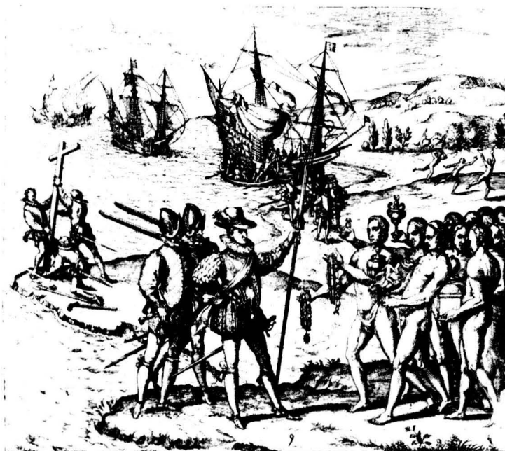
Colom va desembarcar al "Nou Món", i els indígenes van començar a sentir "la descoberta" en la pròpia pell.

tà celebrant, estan cofois, la mort de milers de persones cada dia de fam, o bé que perquè funcioni la societat occidental s'hagin de morir gent a Colòmbia, Beirut, Afganistà, Guatemala... Occident, perquè funcioni, necessita una quantitat impressionant de morts o necessita una quantitat impressionant d'esclavitzats o alienats."