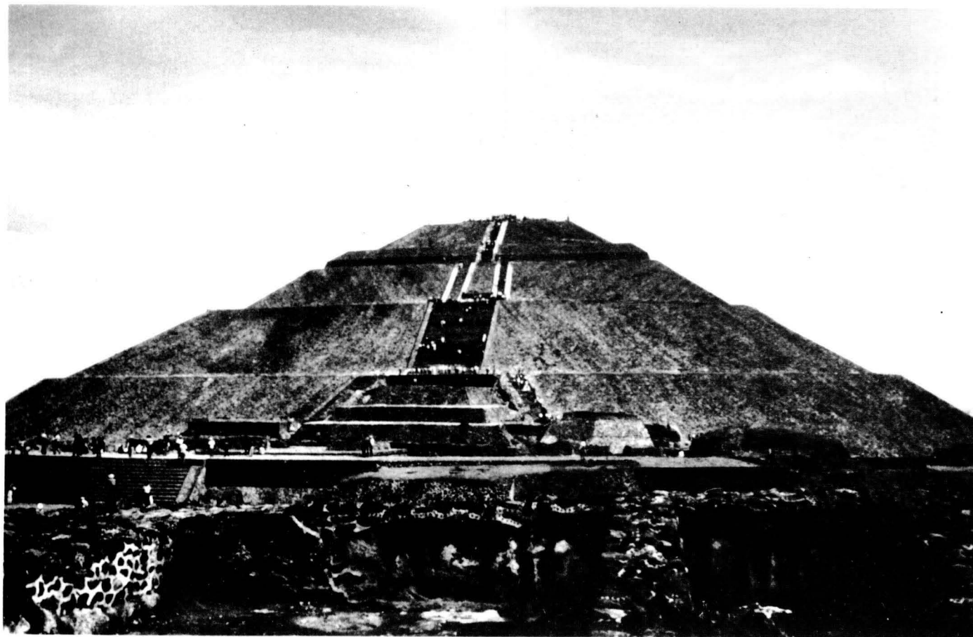
La piràmide del Sol a Teotihuacán (222-225 de base, i 63 d'alçada), la "ciutat dels déus", a Mèxic, un exemple de les civilitzacions pre-colombines.

na una informació de la Colòmbia del s. XIX molt superior a l'oficial."