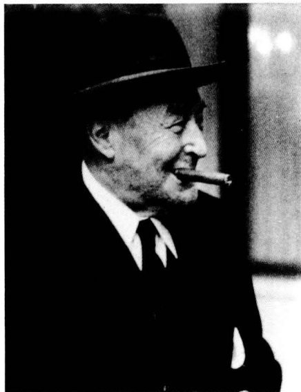
Josep Pla, autor d'una extensa Obra Completa .

Si seguim davant el prestatge i renunciem a la visió de conjunt per llegir els títols que figuren a cadascun dels llocs, és possible que ens arribem a imaginar els cercles —cada vegada més amplis— que es produeixen quan es tira una pedra dins un estany. Llavors, ens podem