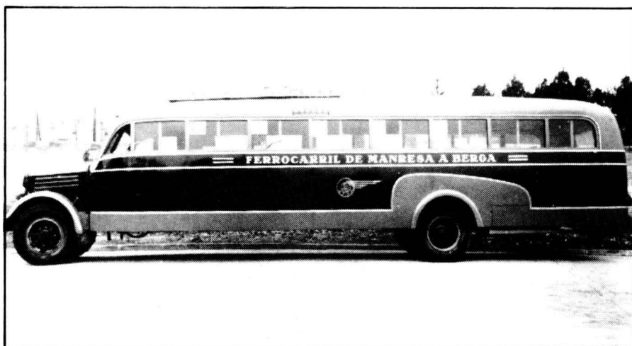
ATSA: cinquanta anys de transport de viatgers.

L'obra de Madoz és, encara avui dia, cabdal per a comprendre i analitzar la història del nostre país durant la primera meitat del segle XIX, essent de consulta obligada, doncs, per a qualsevol estudi sobre el Berguedà d'aquell període. L'Erol felicita des d'aquestes planes la iniciativa de Curial, que continua, amb aquests dos volums, una llarga trajectòria de bon encert editorial.