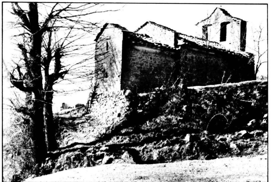
Església de Sant Esteve de Tubau.

En canvi, les de pedra, foren aixecades posteriorment, vers el segle X, sovint aprofitant els fonaments i els blocs de les cantonades de les anteriors i acabant l'estructura amb pedres unides amb argamassa. Sovint es disposava les pedres inclinades formant l'aparell d'espiga o d'espina de peix ( opus scatum ).