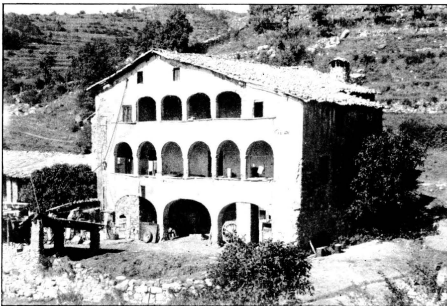
La Masia de "El Bruc", a La Pobla de Lillet

La masia bàsicament de pedra de reble, combina aquest material amb la fusta, a les eixides. La façana i també la resta de la casa estaven totalment arrebossades.