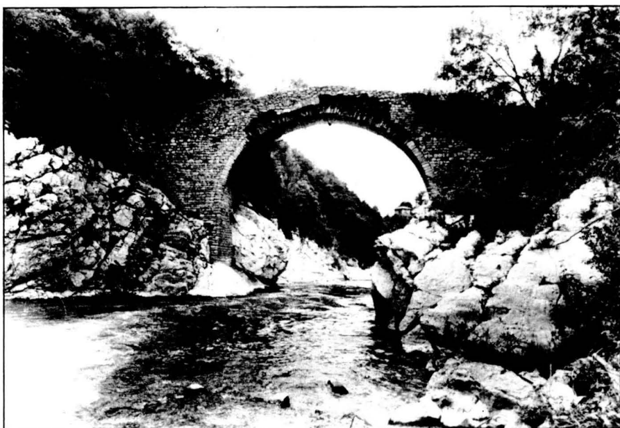
Pont romànic d'Alfar