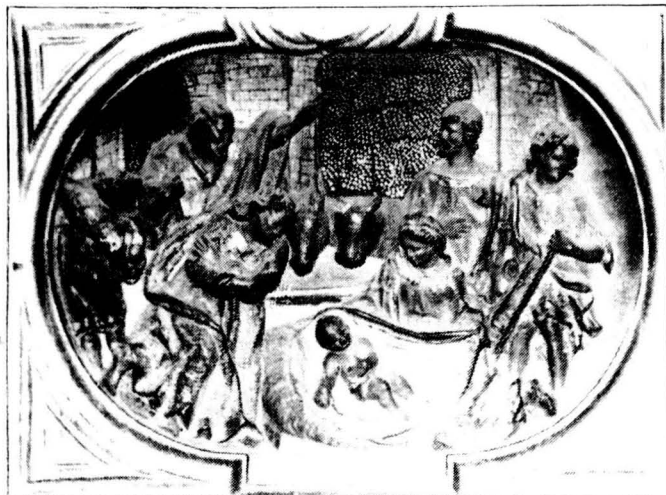
Retaule del Roser, de Correà (Montmajor)