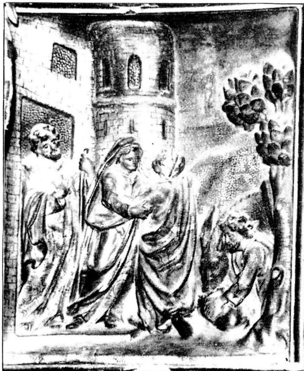
Retaule de Nostra Sra. dels Angels, de Casserres

L'escena de la Visitació de la Verge a la seva cosina santa Elisabet apareix a Casserres i a Correà. La representació és prou gràfica: les dues dones s'abracen mentre Josep alimenta l'ase i Zacaries surt de la casa. Segueix fidelment la font bíblica de l'evangeli de St. LLuc (1,39). Recull, com tota la plàstica barroca, un moment puntual i bàsic de l'episodi, amb una màxima expressivitat en el gest i en el moviment. L'escena de la Visitació, més que pertànyer al cicle de Nadal, és part fonamental de l'exaltació mariana pròpia del barroc. A partir del Concili de Trento i propugnat pels ordes religiosos, especialment els Carmelites i els Jesuïtes, comença la revitalització mariana tan atacada pel protestantisme i, en general, per tots els reformistes. La devoció a la Verge del Roser i al Rosari es popularitzà en aquesta època.