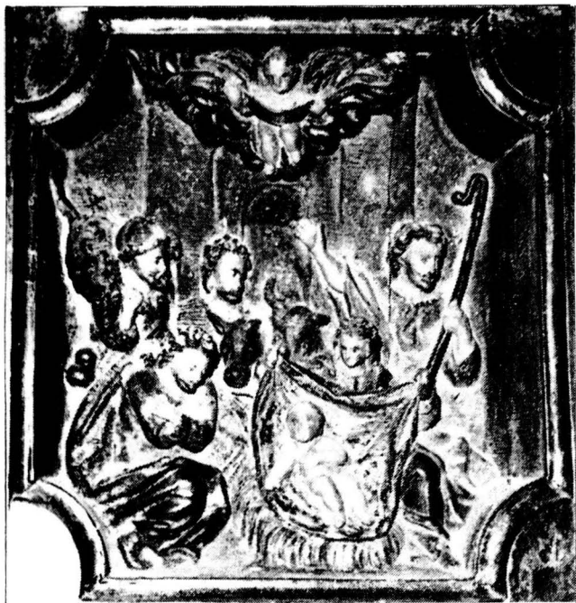
Retaule del Roser, de Montclar