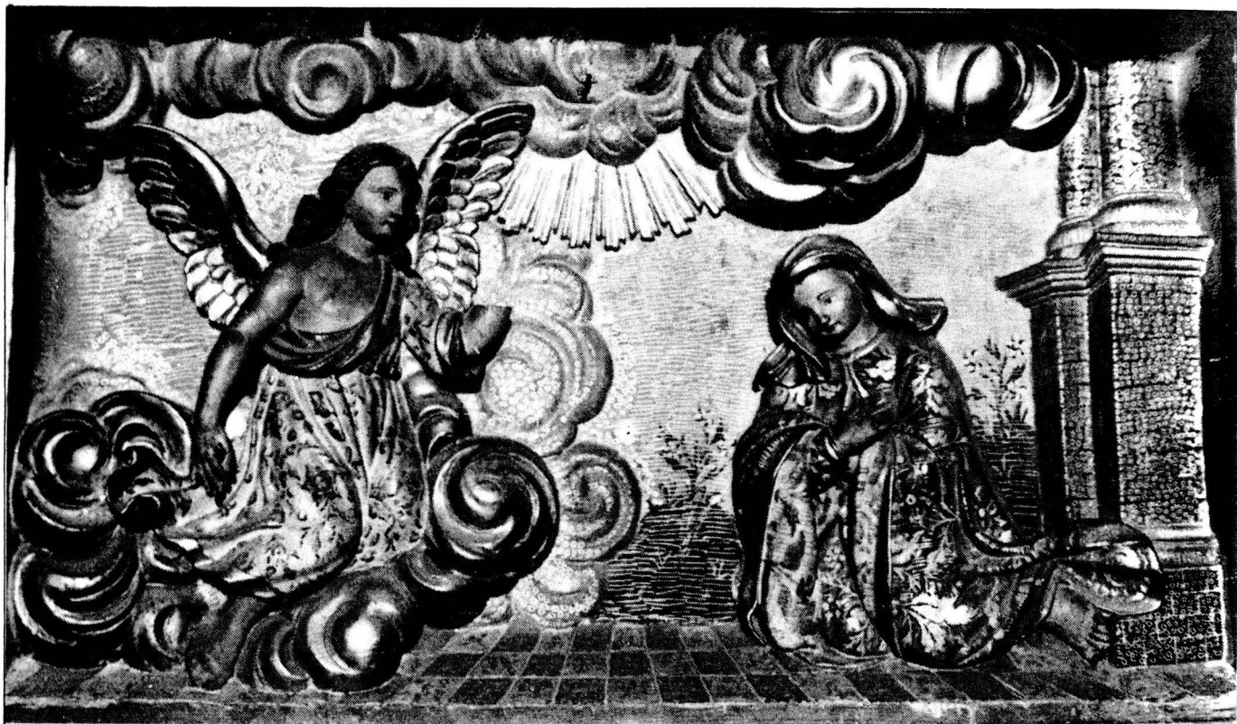
Retaule del Santuari de Nostra Sra. de Paller, a Bagà

El Barroc a Catalunya és marcat per la construcció de grans esglésies, com la de Betlem a Barcelona i la façana de la Catedral de Girona. A la nostra comarca, abans del 1939, també teníem retaules de gran vàlua com el de l'Església Parroquial de Bagà; avui, però, només ens resten obres de mestres menors, malauradament oblidats.