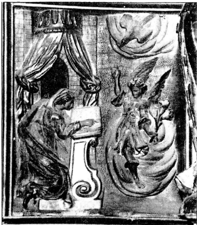
Retaule del Roser, de Correà (Montmajor)