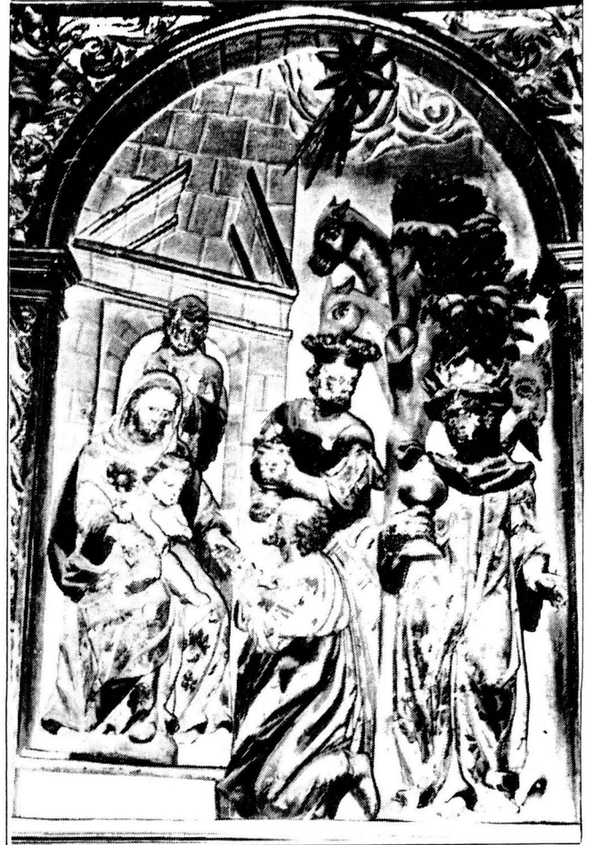
Retaula de Ntra. Sra. dels Àngels (Casserres)

(6). El retaula Major de St. Martí de Montclar és força mutilat. No es coneix el seu autor ni la data de la seva realització, encara que és una obra del s.XVIII.