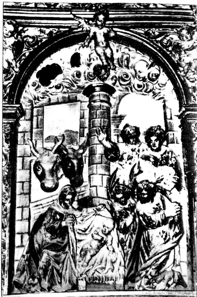
Retaule de Nostra Sra. Dels Àngels, de Casserres

Malgrat que totes les representacions són semblants, cada artista hi imprimeix el seu deix original. El Nen és representat sempre nu —el més pobre entre els pobres—, i la Verge obre el mantell per mostrar-lo als pastors, protagonistes actius de l'escena. Sovint, entre els pastors, hi ha el qui porta el xai als braços o a les espatlles; és l'ofrena a Jesús, però és també el símbol del Crist Redemptor. Sant Josep és situat, sempre, en un segon pla. L'ase i el bou intervenen en l'escena, igualment que en l'època medieval, com a testimonis del naixement del Fill de Déu en un estable. Els àngels són representats, especialment en el plafó del retaule de Casserres i al del Montclar (obra de l'any 1735), mentre que a Correà no hi són representats.