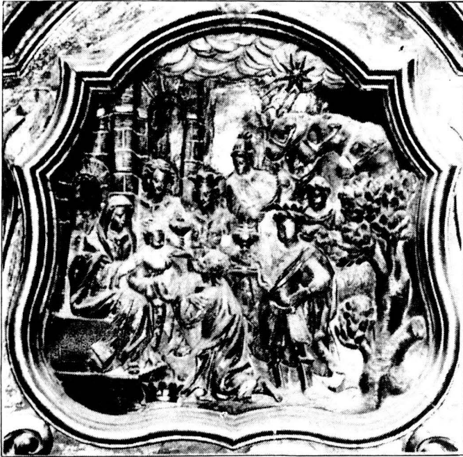
Retaula de Sant Sebastià, d e Montclar

(3). L'església parroquial de Casserres fou ampliada durant els anys 1668 i 1681 sota l'advocació de Nostra Senyora dels Àngels. El Retaula data de l'any 1704. Gran Geografia Comarcal de Catalunya . Tomo II, Barcelona, 1981, pp.276.