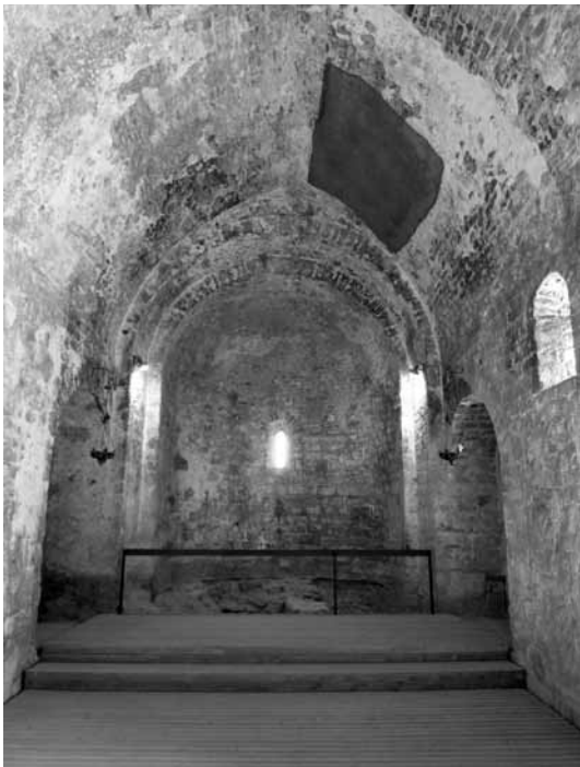
Berga. Absis de l'església de Sant Pere de Madrona, després de la intervenció de 2010-2011, que va posar a la vista les restes de l'antic castell.