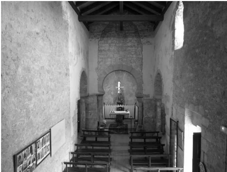
Avià. Interior de l'església de Sant Vicenç d'Obiols, restaurada per Camil Pallàs entre 1959 i 1962, en què es va recuperar la imatge del temple preromànic. ABRIL DE 2012.