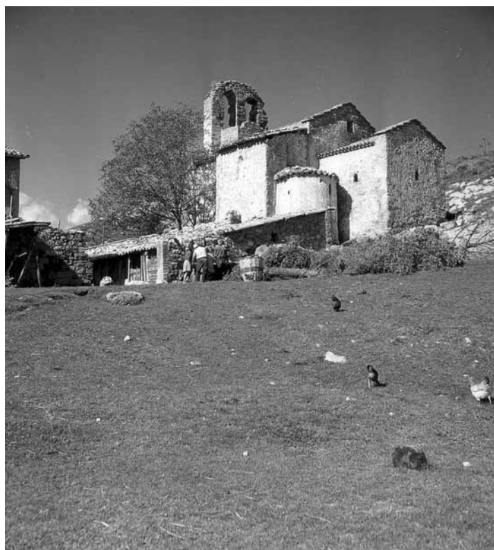
Conjunt monumental de l'església de Sant Quirze de Pedret, ja restaurada per Camil Pallàs el 1964, i de la casa o antic cenobi del davant.