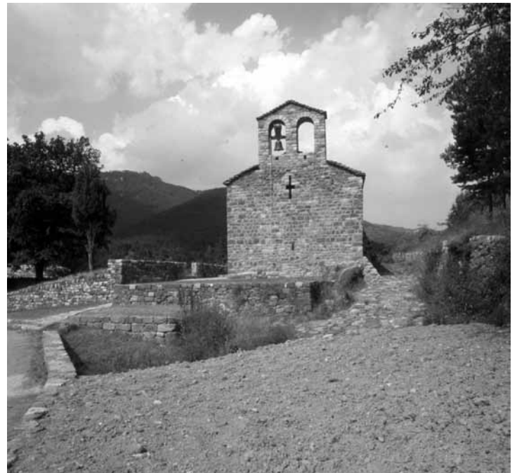
L'església de Sant Vicenç de Rus, un cop restaurada i recuperada la façana de ponent i l'antiga espadanya. FOTO: JAUME SOLER, ARXIU SPAL, DIPUTACIÓ DE BARCELONA, 19 DE JULIOL DE 1988.