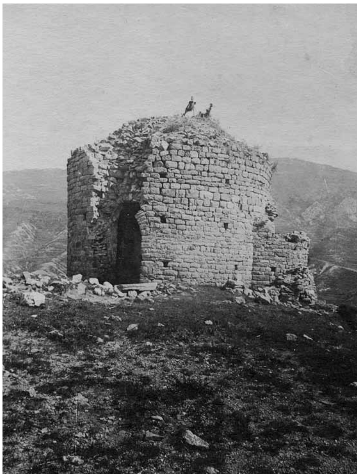
La Pobla de Lillet. L'església de Sant Miquel de Lillet, abans de la restauració portada a terme per Jeroni Martorell.

Quatre generacions implicades en un mateix objectiu, independentment de les situacions polítiques de cada moment històric que els va tocar viure. (1)