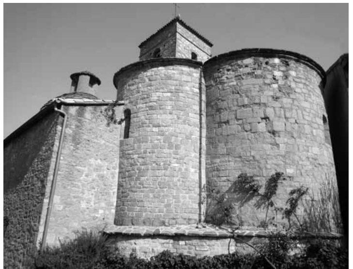
La Nou de Berguedà. Capçalera trevolada de l'església de Sant Martí, restaurada per Camil Pallàs entre 1967 i 1975. FOTO: RAQUEL LACUESTA, ABRIL DE 2011.