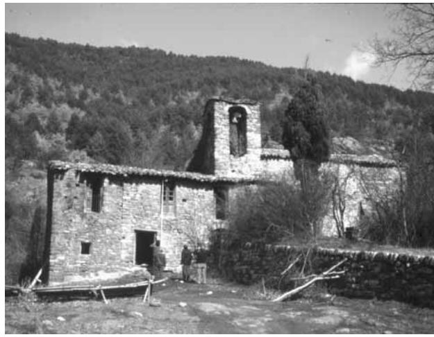
Castellar de n'Hug. L'església de Sant Vicenç de Rus, amb la casa rectoral adossada a la façana de ponent i una torre comunidor al damunt. FOTO: JOAN FRANCÉS ESTORCH, ARXIU SCCM, DIPUTACIÓ DE BARCELONA, 16 DE SETEMBRE DE 1981.