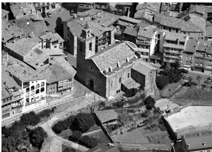
Bagà. Església de Sant Esteve, amb la coberta gòtica recuperada pel Servei de Patrimoni Arquitectònic Local entre 2008 i 2011.

L'actuació a Sant Pere de Madrona (Berga) es va allargar també en el temps. Primer, Pallàs