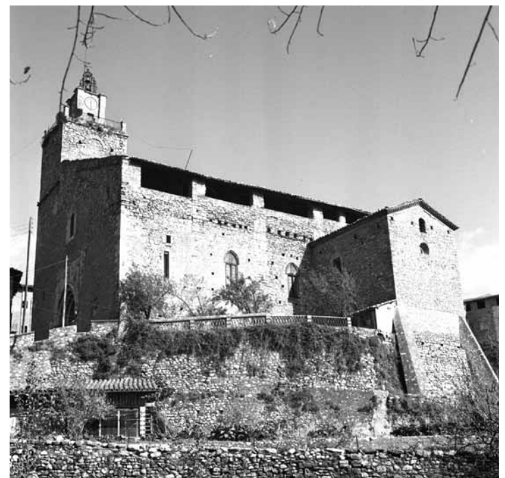
Bagà. L'església de Sant Esteve, quan encara tenia la coberta a dos aiguavessos que es va construir sobre la gòtica al segle XVII. ARXIU SCCM, DIPUTACIÓ DE BARCELONA, 9 DE NOVEMBRE DE 1966.