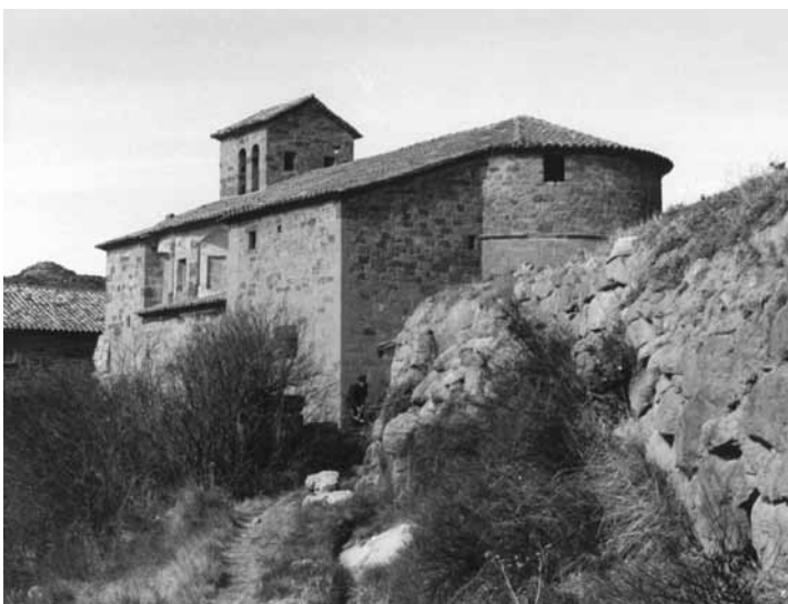
Puig-reig. Façanes sud i est de l'església de Sant Martí, un cop restaurada. ARXIU SCCM, DESEMBRE DE 1970.