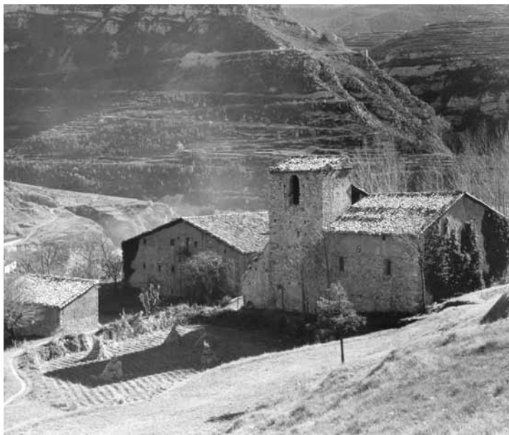
Guardiola de Berguedà. Conjunt del monestir de Sant Llorenç prop Bagà i la casa de colònies, la qual es va desmuntar durant les obres de recuperació del recinte monàstic dirigides per Antoni González i enllestides el 2008.