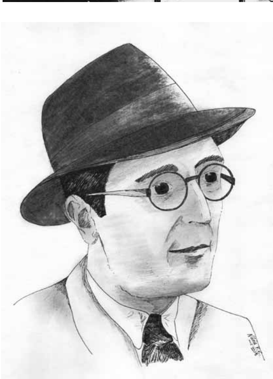
Guilanyà vers 1950. DIBUIX A LA PLOMA I CARBONET DE NÚRIA PUIGDELLÍVOL