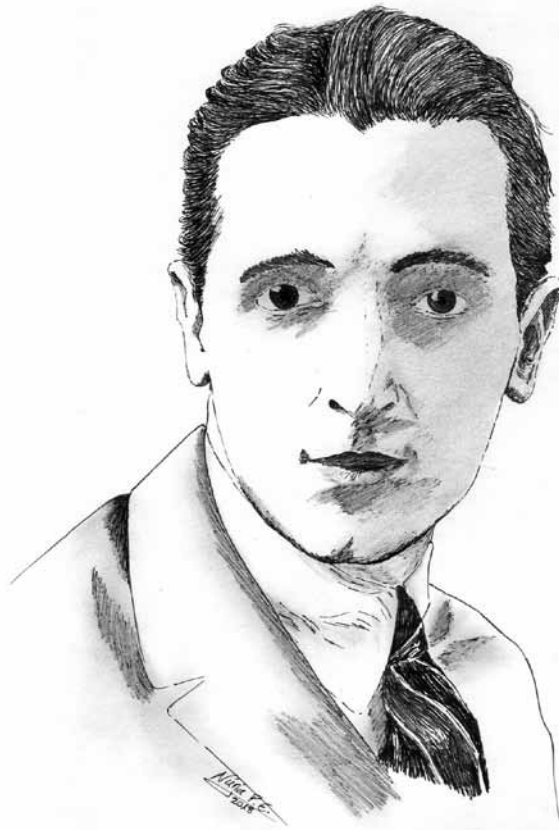
Guilanyà jove. DIBUIX A LA PLOMA I CARBONET DE NÚRIA PUIGDELLÍVOL

De la gesta triomfants se n'obriren solcs a terra. "A les armes catalans que ens han declarat la guerra".