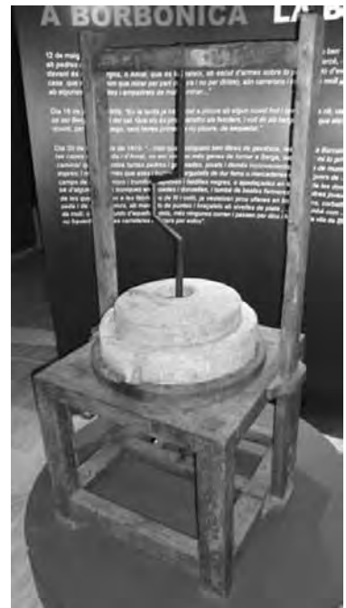
Molí manual, amb dues moles. ESPAI BERGA