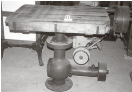
Model similar de vibradora.

El gènere s'havia d'entrar i de treure amb una cavalleria (a bast) o bé amb un carretó o a coll. Hi arribaven normalment passant pel pontet del Rigatell (l'accés principal) i, en algun cas, per una porta exterior del primer pis.