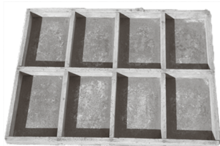
Motlles de xocolata a la pedra de Xocolates Fàbregas.