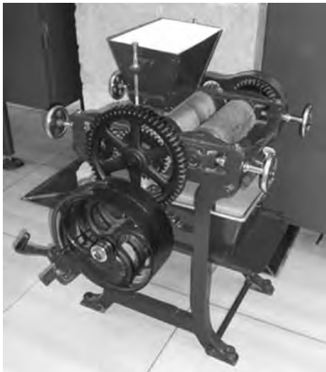
Afinadora. MUSEU DE LA XOCOLATA, BARCELONA.

Si es volia fer un producte de més qualitat s'utilitzava llavors una afinadora , que també era moguda per la corresponent corretja d'un embarrat. Disposava de tres corròns paral·lels, entre els quals es feia passar la pasta de xocolata provinent de l'amassadora, per tal que adquirís una textura més fina, ideal per al paladar. A dalt hi havia una tremuja i a sota, els corròns, que giraven sobre uns eixos dels quals només solia estar fix el del corró central, de manera que els altres dos es podien desplaçar lleugerament accionant uns volants (n'hi havia quatre, dos a cada costat de l'afinadora).