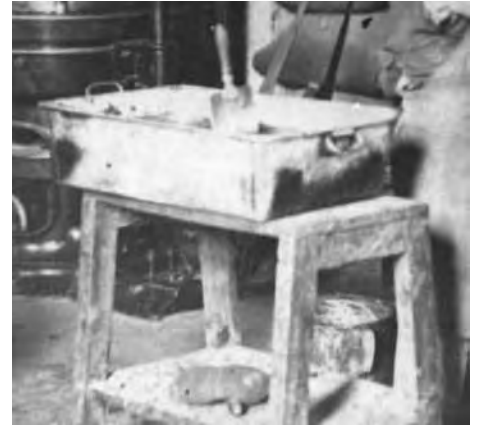
Pastera de Xocolates Fàbregas, amb un lliurador a dins. (DETALL D'UNA FOTO DE L'ARXIU D'EDUARD PUJALS)

nir lleugerament calent perquè la pasta de xocolata no s'endurís i fos possible treballar-la. S'escalfava mitjançant uns brasers de carbonet posats a dins o a sota. Aquesta operació sempre es feia al matí, unes hores abans de començar, de manera que arribat el moment estigués calent i amb el caliu dels brasers n'hi hagués prou per a mantenir-lo a la temperatura adient.