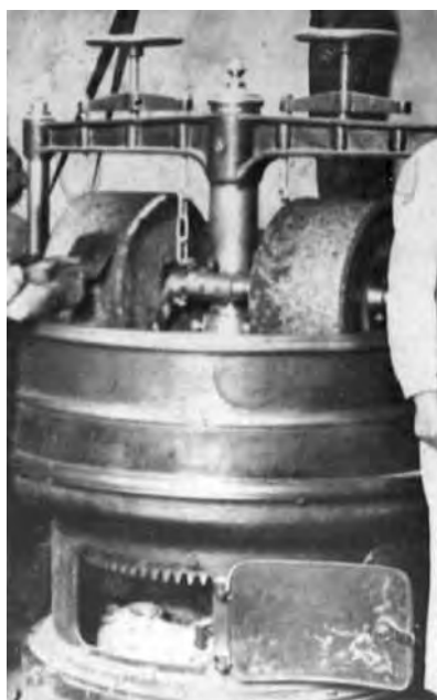
Mescladora de Xocolates Fàbregas.

Quan la massa era prou fina es treia i s'anava agregant formant boles, que era la forma en que es transportava.