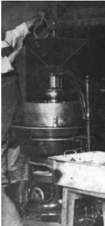
Molí de cacau de Xocolates Fàbregas.