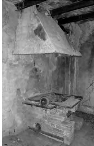
Estat actual de la torradora est del molí vell. S'observa encara una politja.

A l'entorn de 1900 es van modernitzar i van passar a utilitzar maquinària industrial (5). D'ara endavant explicaré com s'efectuava la producció en aquesta nova etapa, de la qual tenim molta més informació.