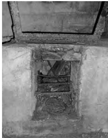
Fogaina i braços mòbils de la torradora oest del molí vell.

La torrefacció de les faves de cacau tenia lloc en les torradores , que consistien en una estructura d'obra damunt la qual hi havia una esfera metàl·lica d'uns 40 cm de diàmetre, proveïda d'una porteta, subjectada per uns pivots laterals a dos braços basculants i que girava per l'acció