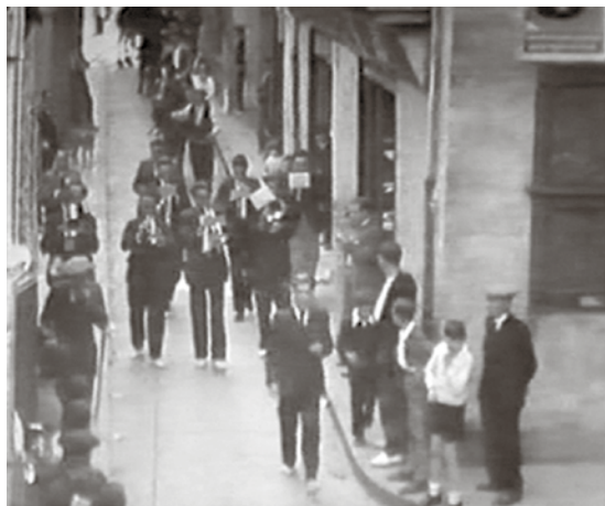
Aspecte extern de la botiga. Imatge extreta de la filmació "La dansa a l'ermita de Falgars", de R. Puiggròs, feta el 1923.