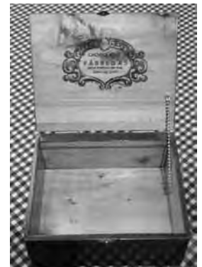
Cromo (anvers i revers) i caixa de premi. (ARXIU DE XAVIER FÀBREGAS)