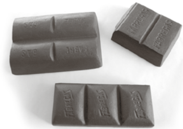
Reproduccions de diferents models de preses de Xocolates Fàbregas, fetes de guix a partir de motlles originals.