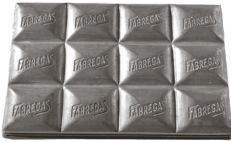
Motlle d'una rajola, per fora i per dins.