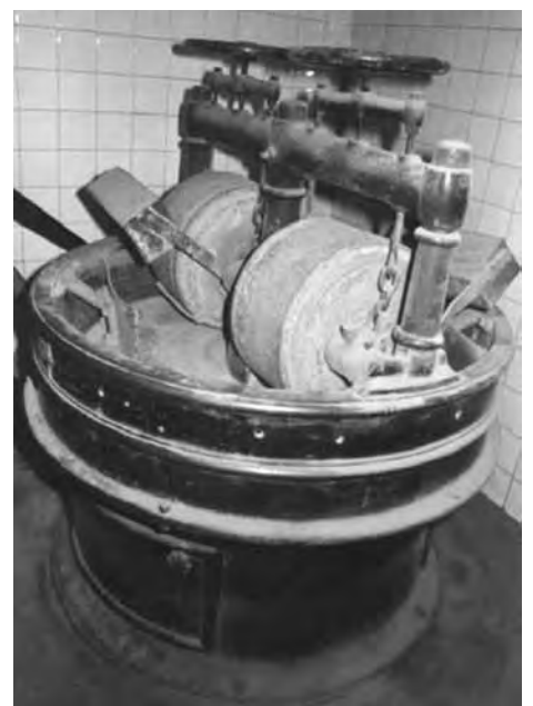
Model similar de mescladora.