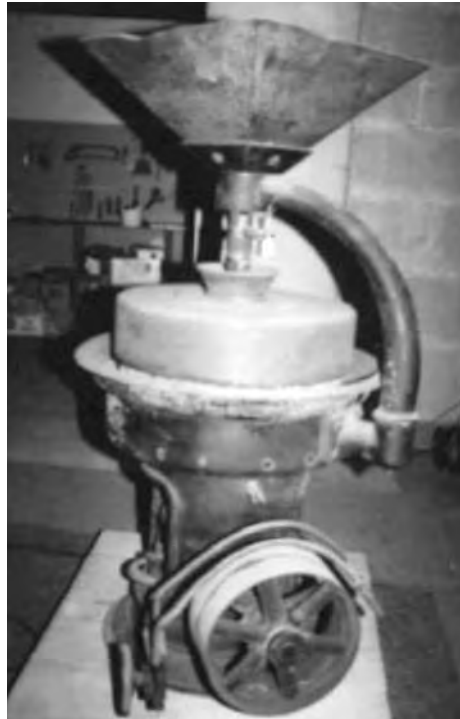
Un model similar de molí.