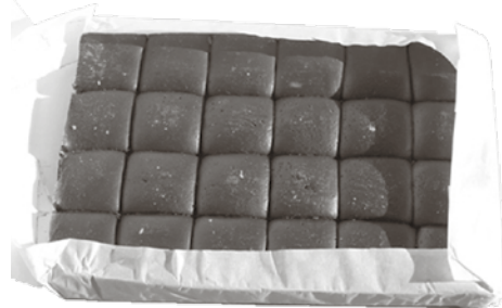
Presentació actual similar de xocolata a la pedra.

La xocolata en pols es podia preparar tant molent la xocolata ja feta com barrejant cacau en pols, sucre i farina. Desconec quin d'aquests sistemes utilitzaven. La venien a la botiga, en bosses de cel-lofana. Aquesta varietat la devien incorporar en temps més moderns.