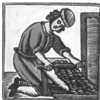
Gravat antic amb un xocolater treballant amb el corró i la pedra.

Sabem que al obrador de la botiga havien utilitzat un molí manual (4), però desco-