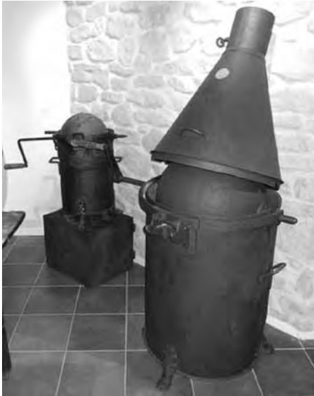
Torradores antigues d'ametlles i d'avellanes. MUSEU XOCOLATA VICENS, AGRAMUNT.

rampes mòbils; el cacau, mentre es molia, anava baixant fins que vessava, sortia per unes obertures perifèriques i es recollia.