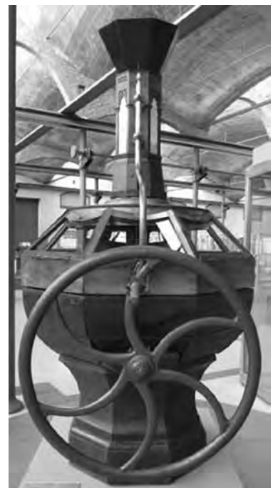
Molí manual de quatre corròns..

neixem com era en realitat ja que aleshores n'hi havia de diferents menes: