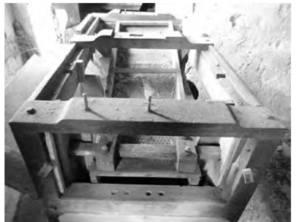
Estat actual de l'espellofadora. (Falta el mecanisme que sacseja la safata perforada).