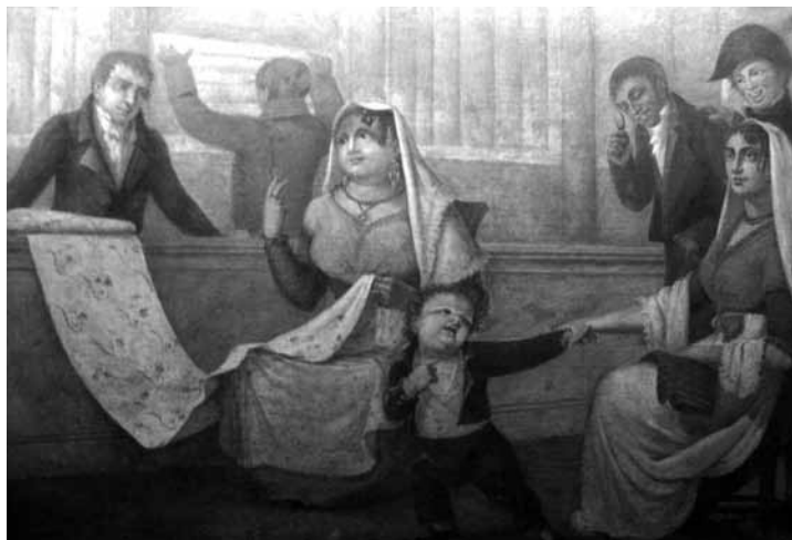
Botiga d'indianes, Barcelona. Gabriel Planella, 1824. (COL·LECCIÓ MUHBA)