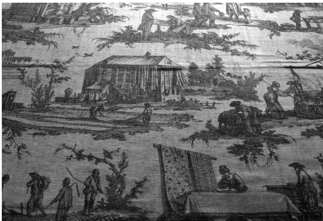
Interior de la manufactura d'indianes Wetter, a Orange (MUSÉE D'ART ET HISTOIRE D'ORANGE)