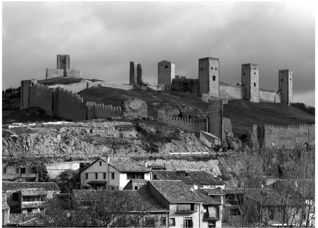
Molina de Aragón, un dels llocs on gironellencs van fer-hi negocis i estada