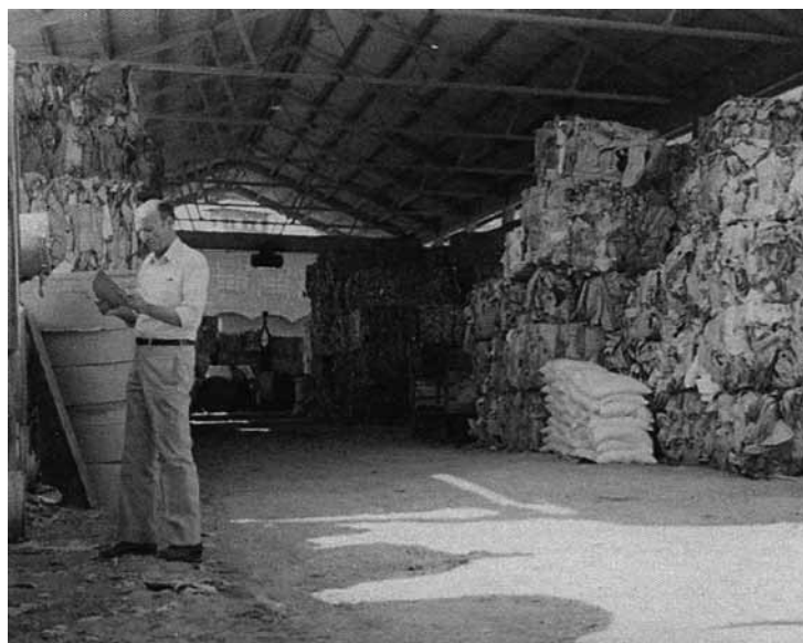
Magatzem de la fàbrica de paper de cal Barral

i vol que la seva activitat sigui respectuosa amb el medi ambient. Per això té establert un sistema de gestió ambiental certificat segons la norma UNE EN ISO 14001 que és una normativa internacionalment acceptada que expressa com establir un sistema de gestió ambiental i la UNE EN ISO 9001 que estableix una norma per a la Gestió de Sistemes de Qualitat. L'empresa ha volgut aconseguir aquests certificats d'una forma totalment voluntària. Aquests certificats,