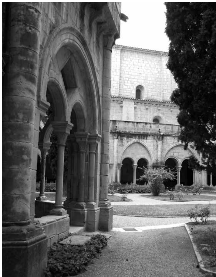
Claustre del monestir de Santa Maria de Poblet.

els grans monestirs, com Santa Maria de Poblet i Santes Creus, mitjançant donacions i privilegis, obtenen dels senyors feudals el dret de pas entre la plana i els Pirineus. Es crea així una xarxa de camins ramaders per on el bestiar pot travessar el país sense entrebancs i que, posteriorment, serà utilitzada també per la resta de propietaris de bestiar.