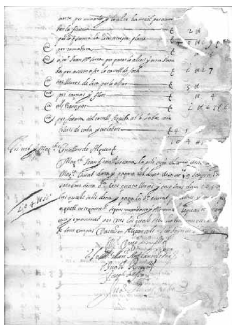
Document de l'Arxiu Històric de l'Ajuntament de l'Alguer (ASCA)

El 7 d'octubre de 1571 l'exèrcit turc va ser derrotat pels cristians a la batalla de Lepant; el nom podria venir d'aquest fet. A d'altres indrets de Catalunya les comparses semblants s'havien anomenat Cavallets