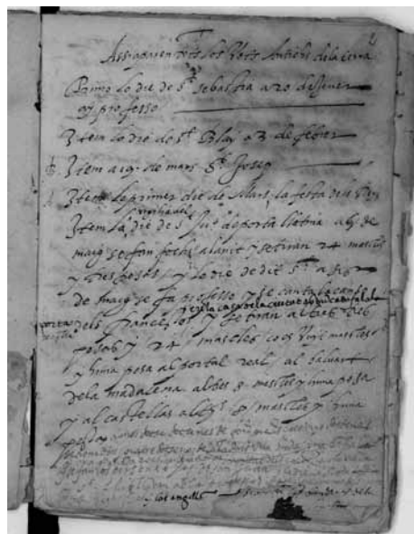
La documentació demostra la riquesa del Corpus de l'Alguer (ASCA)

mateix any per la despesa de "lo Salamo".