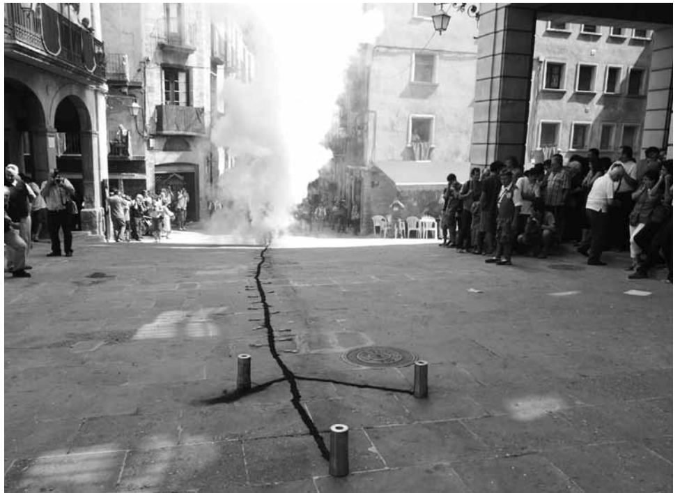
Mascles a la Festa del Corpus Domini de l'Alguer

Però el nostre passat de catalans és el mateix.