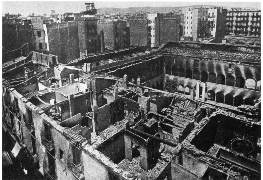
Imatge d'un convent cremant a la Ronda Sant Antoni de Barcelona.

el conjunt del territori espanyol, necessitaven més temps per arrencar del govern una reobertura de les Corts o abonar directament una vaga general. Per la seva banda, els radicals de Lerroux, que en aquells moments tenien el seu caudillo a punt d'abandonar Buenos Aires, van posar en mans dels « anarquistes domesticats » que feia poc que s'havien incorporat al partit les accions que ben aviat caldria emprendre. La veritat és que, als lerrouxistes, més que indisposar-se amb els militars –amb alguns dels quals comptaven per a la hipotètica revolució que alguns dies hauria de fer–, els interessava