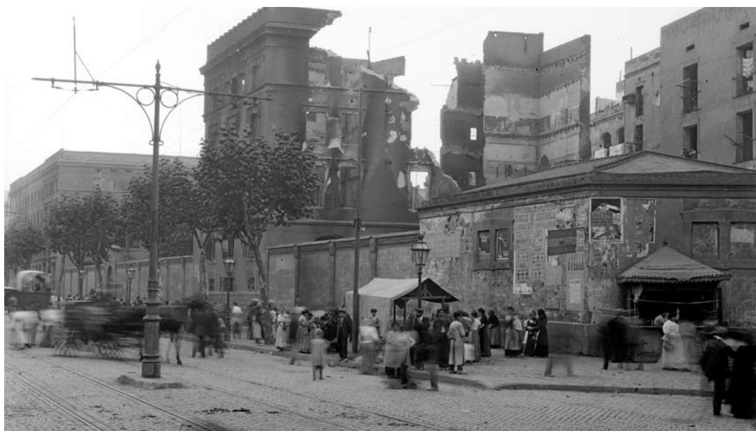
Restes del col·legi de les Escoles Pies, a la Ronda de Sant Antoni de Barcelona.