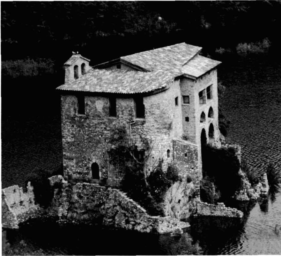
Fotografia de Sant Salvador des de la carretera de la Nou; la imatge, del 2004, mostra el conjunt amb la teulada restaurada

va fer restaurar el temple de Sant Salvador de la Vedella i va fer que el seu cosí, Antoni Viladomat, el decorés.