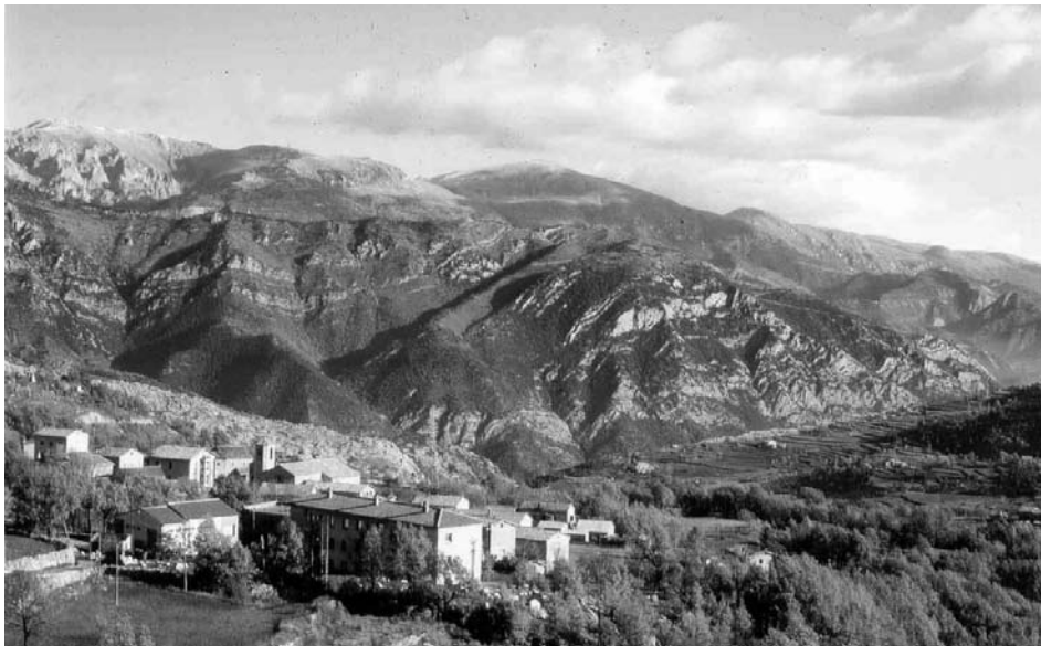
Vallcebre.