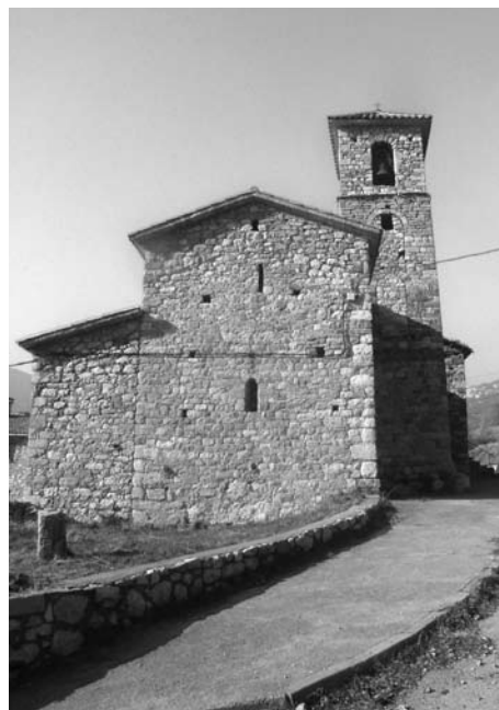
Santa Cecilia de Fígols (RSR)

Com és lògic, Ramon de Peguera no es va quedar amb els braços plegats i recorregué al rei per informar-lo que la universitat de Berga no volia reconèixer els drets senyorialis que havia adquirit sobre Peguera, Vallcebre, Fígols, la Vadella i Cercs. Amb data 22 de setembre el rei envià una carta al sots-veguer de Berga (del qual no se cita el nom en cap ocasió) i al porter reial, Ferrer de Coll, dient-los que tornessin les possessions al Peguera, però aquests no en feien cas i, per tant Ramon de Peguera continuava insistint davant el rei. Cansat de sentir-lo, el rei feia escriure una segona carta en aquests termes: