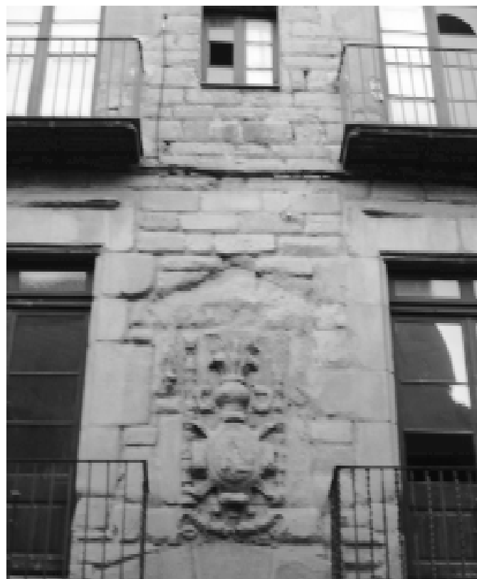
Gresos esculpits a la plaça de Sant Joan de Berga. M.GORCHS