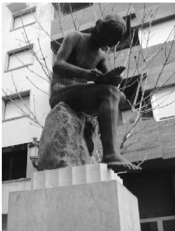
El nen de l'espina assegut sobre riolita de Gréixer (roca volcànica) a la plaça de les Fonts de Berga.