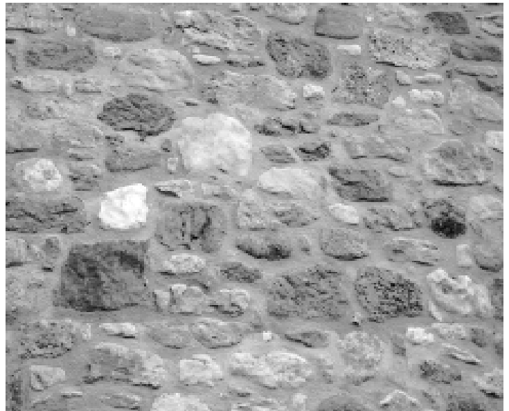
Mostra de roques sedimentàries que revesteixen una paret externa en una masia del Baix Berguedà. M.GORCHS