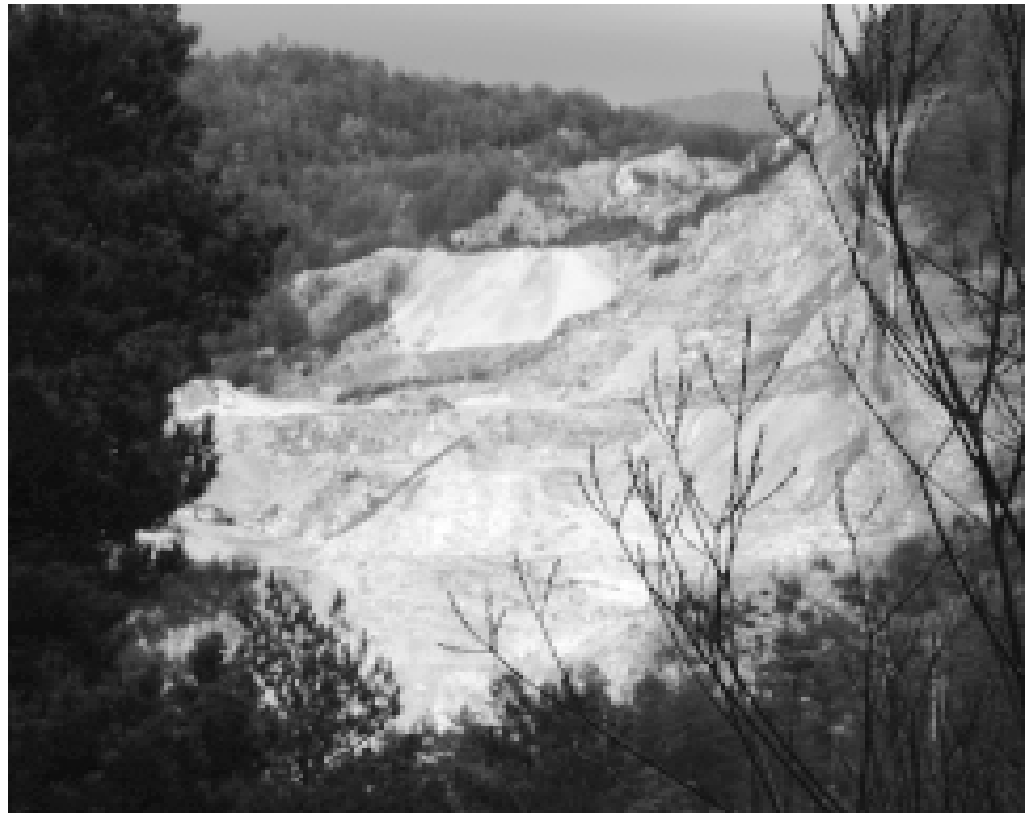
Pedrera de guixos a La Pobla de Lillet. M.GORCHS

El carbó és una roca berguedana també amb nom propi, el lignit. Tenim una conca a la zona de l'Alt Berguedà farcida per dife-