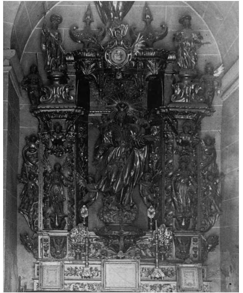
Figura 1, retaule del Sant Crist d'Avià. Figura 3, retaule del Roser de Tentellatge. Figura 4, retaule de l'Assumpció d'Olius.