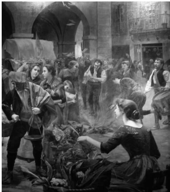
La crema del paper segellat segons un quadre del pintor nascut a Berga Francesc Cuixart (1895). AJUNTAMENT DE MANRESA.

Segons Josep Fontana, al Bruc hi van haver tres batalles: dues contra els francesos i una tercera que es va allargar molts anys després de la contesa entre les ciutats de Manresa i Igualada per veure a qui calia atribuir el mèrit principal en la victòria i qui havia aportat més gent a aquells combats. Aquestes qüestions van generar una agra disputa que va omplir pàgines i més pàgines de diaris i va portar a la publicació d'un bon nombre de pamflets i opuscles. Des del punt de vista més acadèmic, sembla que la controvèrsia va començar per part dels igualadins arran de la publicació l'any 1862 d'un opuscle de Josep Puiggarí titulat La jornada del Bruch. Vindicación de Igualada sobre su principalidad en la misma . Aquesta obra va ser objecte de nombroses rèpliques i contrarèpliques, com ara la del prevere i llicenciat en filosofia