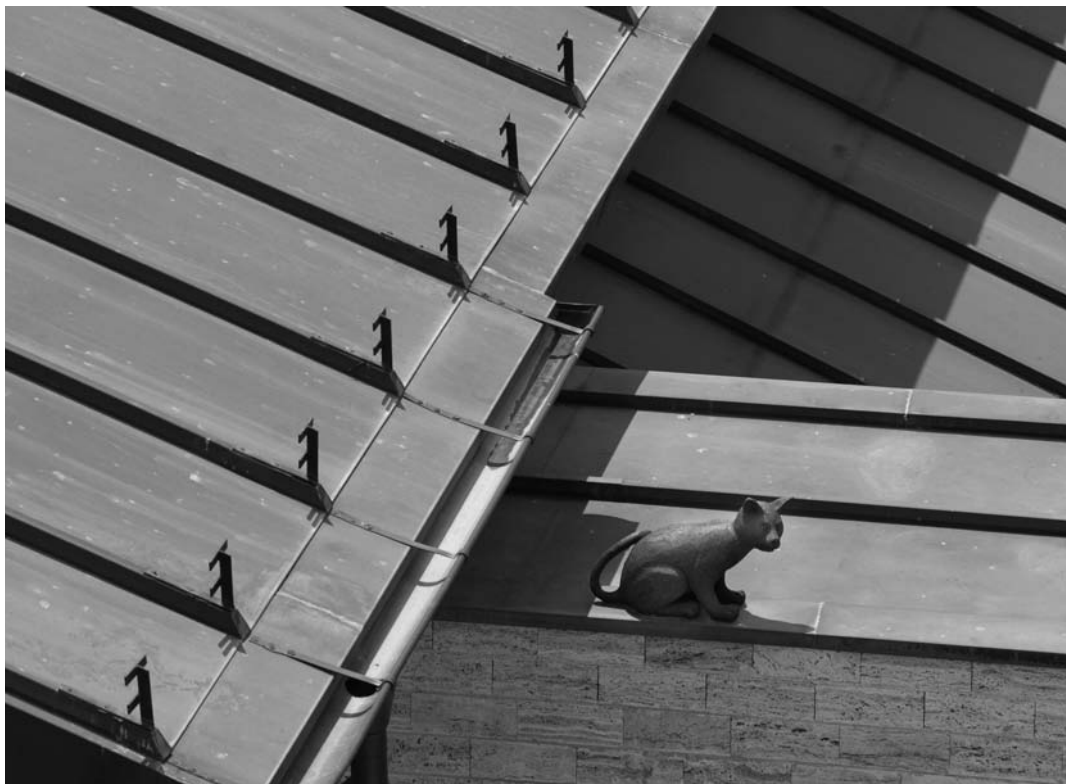
La gata "Liza" sobre la teulada del nou monestir.

JULIOL 2008.