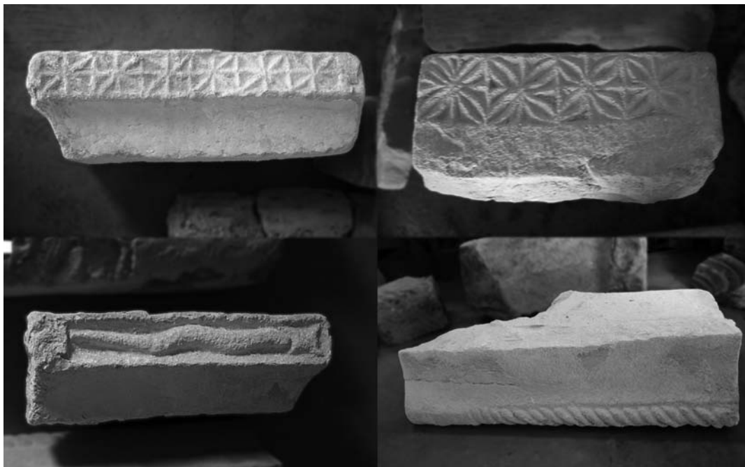
Impostes medievals decorades amb relleus escultòrics.

conditoris, motlures de cornises i angelets de guix o de morter de calç. (2) Un conjunt heterogeni que ens remuntava a les èpoques medieval i barroca, els dos períodes històrics en què el monestir o l'església van desenvolupar les seves funcions amb regularitat. Una escultura, per altra banda, subsidiària de l'arquitectura, i d'una decoració extremament austera, com austeres eren les construccions dels segles X al XII que ens han arribat del cenobi. Els relleus que decoren aquestes pedres trobades manifesten en general un treball d'escassa complexitat fet amb cisell i punter per artesans o picapedrers i amb una