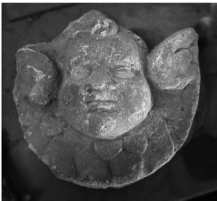
Querubí i capitell decorat amb pinyes. FOTOS: A. LÓPEZ MULLOR I D. GALÍ, 2005. FONDS DOCUMENTAL SPAL.

obertura en arc de mig punt, amb dovelles a l'extradós que envolten un altre arc monolític de doble esqueixada. Les peces pètries que estan decorades amb relleus són els brancals, per les dues cares, i l'arc monolític, que només presenta en un dels seus angles exteriors una roseta de sis pètals inscrita en un cercle. Possiblement, els que considerem brancals de la finestra van ser executats al segle XI, però pel tipus formal i per la temàtica emprada podem encabir-los dins de la tradició del segle anterior. Tres de les cares dels brancals tenen com a motiu ornamental un conjunt de cadenes consistents en un entrellaçat de tres voltes o bucles de cintes concèntriques, en dos dels casos, que ocupen la totalitat de la superfície, i en dos bucles, en el tercer cas. Aquest darrer dibuixa un vuit (l'espiral del cel) i l'espai resultant de la pedra és ocupat per dues rosetes de quatre pètals inscrites en quadrats. La cadena fa al·lusió, d'una banda, al caduceu de Mercuri, i de l'altra, al concepte de lligam entre el cel i la terra, de comunicació. La quarta cara del brancal està buidada en part per aconseguir donar relleu a una figura humana, la qual queda encerclada pel voraviu rectangular resultant del buidatge del bloc de pedra. La figura, dreta i en posició frontal, dirigeix, però, les passes i els braços cap a un costat, en actitud de moviment.