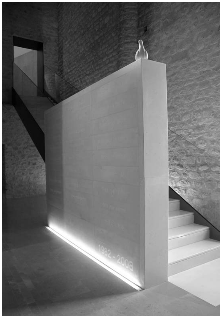
El mur políglota del Retaule de la Pau.

La façana de llevant reconstruïda també exigí resposta a un problema. Per compensar la poca esveltesa del seu contorn,