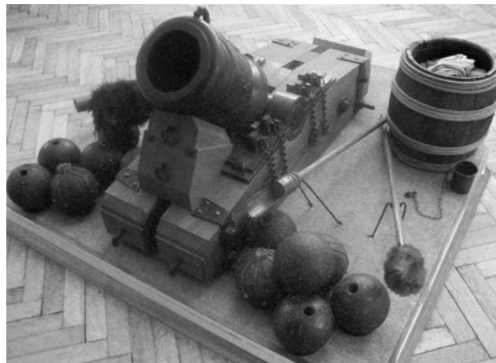
Mortes, segle XVIII. MUSEU MILITAR DE VIENA

La revolució política austriacista va venir acompanyada, també, d'una revolució militar. Sovint s'ha dit que Carles III no va confiar en els catalans, ja que no va organitzar unitats militars catalanes. Tal percepció, contínuament repetida per la historiografia catalana, és del tot grollera, i demostra el dèficit estructural que els nostres historiadors tenen sobre temes militars. Carles III va operar de manera genial, va entendre la problemàtica dels catalans, va intuir la potència dels furs i va saber utilitzar perfectament les possibilitats que li ofería aquell país de mísera demografia i que alhora era la base i el centre neuràlgic de la seva política. Entre els anys 1705 i 1713, Carles III va sufragar regiments catalans, reglats professionals d'infanteria i cavalleria. Van ser pocs regiments, òbviament, els que podien subministrar un país que amb prou feines superava el mig