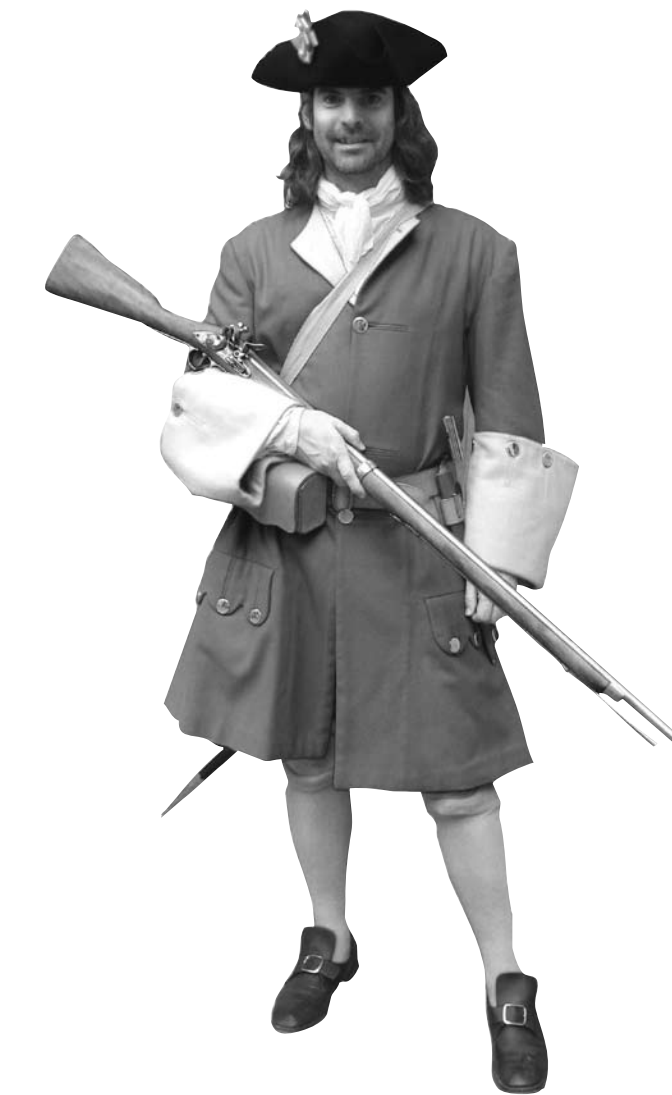
Soldat del regiment de la Diputació (Recreació miquelets de Catalunya).

Pel que fa a l'uniforme dels miquelets cal assenyalar que era més auster que el d'infanteria. Portaven camisa i al damunt un geleco, o jupa sense mànigues. Les calces eren molt amples i portaven calsilles per protegir les cames. El calçat usual eren les espadenyes. La prenda principal era el gambeto, més lleuger i sense tanta volada com la casaca. Al cap portaven el característic tricorni. La uniformitat es manifestava principalment en el color de fons del gambeto i en la divisa de les gires d'aquesta peça, tot i que el geleco o camisola i les calces també podien denotar uniformitat. Portaven polvorera; no sembla que utilitzessin cartutxos. La polvorera devia