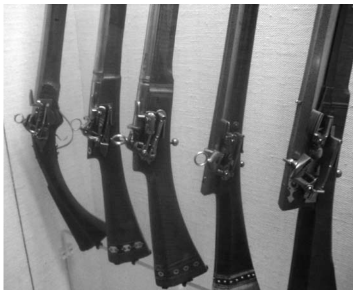
Arcabussos turcs amb pany miquelet (Museu Militar de Viena).

Diu la llegenda que els defensors de la ciutat de Baiona, un cop esgotades les municions, van lligar ganivets a les puntes de les seves armes de foc i que així va néixer la baioneta. Tanmateix, és molt possible que el nom de l'artefacte derivi de la paraula beineta ('funda'). Les baionetes apareixen a finals del segle XVII, i el seu ús s'estandarditza i sistematitza durant la primera dècada del segle XVIII. Les