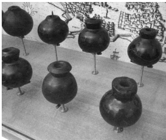
Magranes. Granades de mà. MUSEU NAVAL DE VENÈCIA I MUSEU MILITAR DE VIENA

tot amb la baqueta. Tanmateix, la introducció del cartutx no va ser ni ràpida ni homogènia, i alguns exèrcits van continuar utilitzant la polvorera amb dosificador de pólvora. També es van utilitzar durant força temps petites polvoreres de pólvora fina per encebar les cassoles amb pólvora de qualitat. Aquests processos de càrrega forçosament s'havien d'efectuar a peu dret. Era gairebé impossible preparar un fusell estant estirat a terra. De tot això se'n van derivar algunes casuístiques, la més important era, precisament, la de combatre drets. En efecte, la imposició d'haver de municionar drets, sumada a la imprecisió, la baixa letalitat i la lenta cadència de foc feien que no valgués la pena lluitar a cobert. Era més pràctic lluitar drets, ja que les possibilitats de rebre un tret eren relativament escasses.