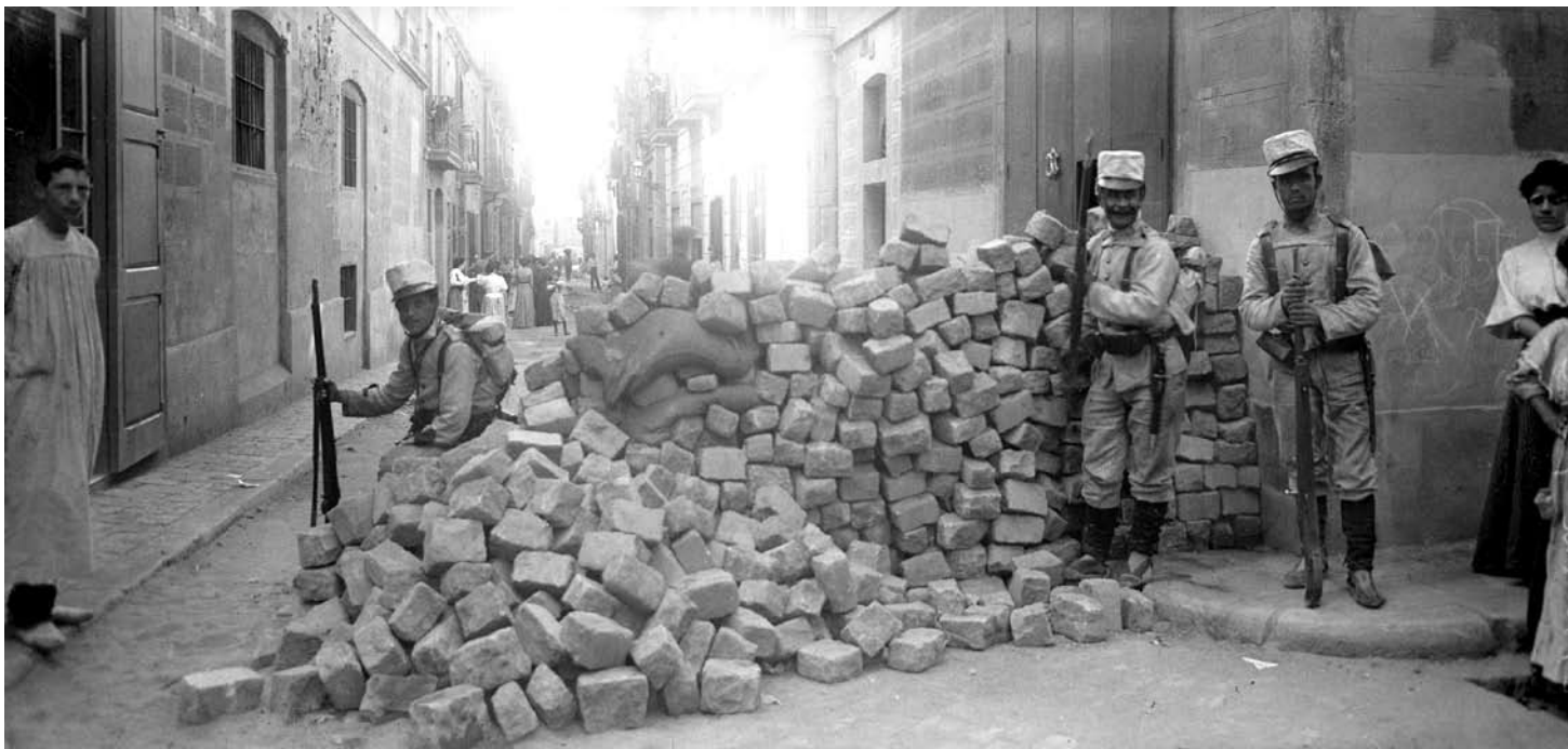
Soldats davant d'una barricada feta de llambordes al carrer Sant Pere Màrtir, del barri de Gràcia, Barcelona.