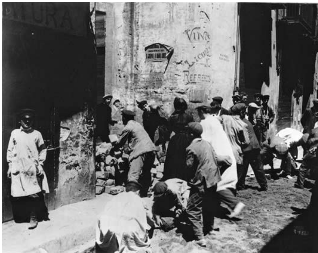
Aixecament d'una barricada per part dels revoltats.

Tot el contrari es pot dir dels dibuixos i il·lustracions publicats en revistes i diaris de l'època (com l'Esquella de la Torratxa, La Campana de Gràcia, El Papitu o el Cu-Cut) que, seguint la tradició satírica del segle XIX caricaturitzaven i acusaven els més poderosos i a l'església de provocar les