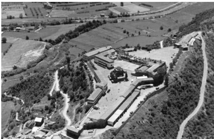
Vista aèria de l'aquartermament que acollí al Batallón de Cazadores de Montaña Cataluña nº 4.

en el control de l'ordre públic en moments puntuals, els ex captius que s'integraran en els ajuntaments desenvolupant una tasca eminentment repressora denunciant a republicans o l'església que, molts cops, es convertirà en còmplice de la política repressiva endegant una gran tasca informadora.