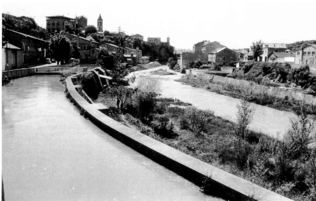
El rec del molí es convertí, amb els anys, en el canal de la fàbrica de Cal Metre.

Les obres deuriem començar tot seguit, ja que el 18 d'aquell mateix febrer es féu un inventari de tot el que hi havia en el molí de Puig-reig (9), per tal de saber què havien de tornar els Coma quan acabessin els 19 anys de l'usdefruit. La resclosa va créixer a bon ritme ja que les obres es realitzaren amb poc més de la meitat del temps previst, segons quedà anotat en el Llibre d'Actes del Comú el 20 de desembre de 1837: havent finida i conclosa l'obra de la resclosa del molí fariner de la vila de