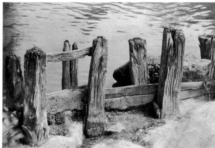
Sistema de construcció de les antigues rescloses. R. VILADÉS.

També continuava l'exigència "d'eixugar el rec", obrint els bagants per buidar-lo, sempre que els regidors ho creguessin convenient, per tal que els vilatans poguessin agafar peixos per al seu consum.