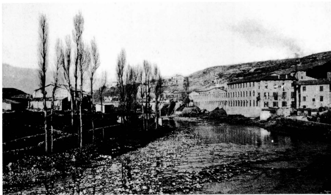
Cal Metre a començament del segle XX. L'edifici de més a la dreta era l'antic molí.

Primer: Tot aquell molí fariner que aquest noble senyor, pels justos i legítims títols dels seus predecessors, té i posseeix en el terme i parròquia de Sta. Eulàlia de Gironella, a la vora del riu Llobregat, amb l'aigua per moldre, el rec, la resclosa, els estalladors i les moles, riscles, tremugues i demés aparells per moldre, amb la casa dins la qual estan contruïts els molins, amb les seves entrades i sortides; la qual casa i molí afronta, a sol ixent, amb el molí draper que està construït davant el