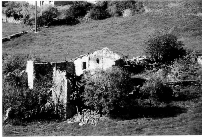
Al costat de masies que cauen (Cal Baraut, Gisclareny), s'habiliten segones residències (Cal Sastre i Cal Berta, Gisclareny) R.VILADÉS