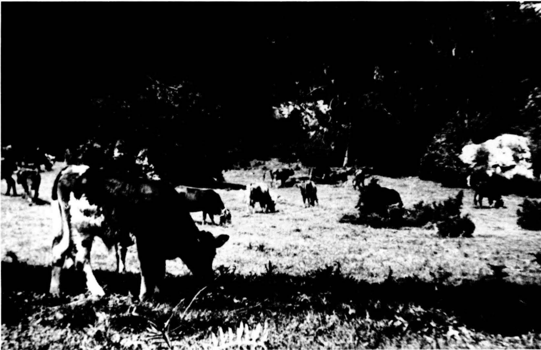
La zona del Catllaràs està inclosa en un PEIN.