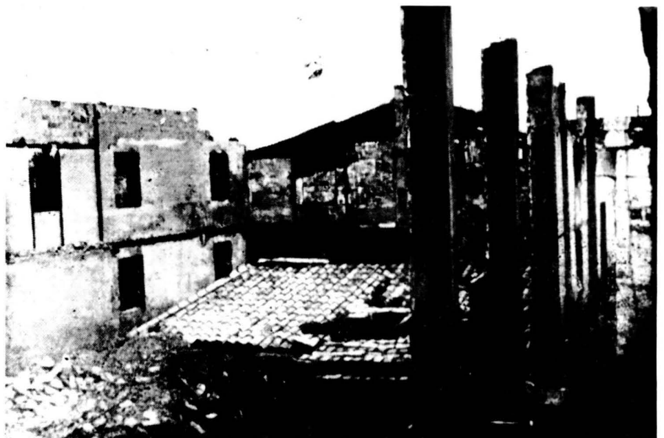
El teatre del "Frontón", cremat.