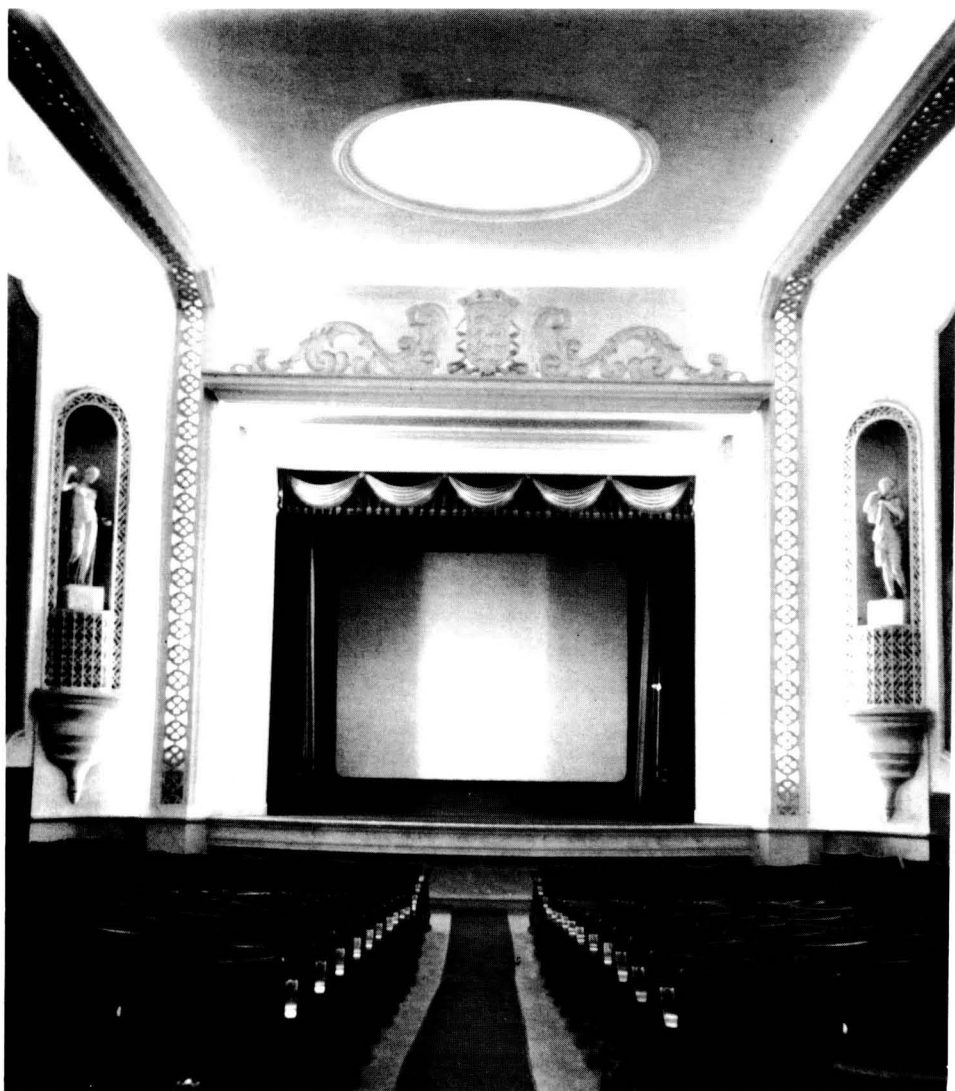
El Cinema Catalunya, inaugurat l'any 1951