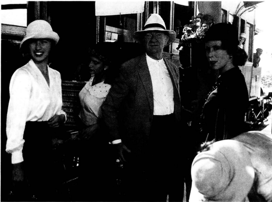
Belle Époque, de Fernando Trueba. Un dels majors èxits del cinema espanyol dels últims anys, en què ha iniciat una progressiva reconciliació amb el seu públic.