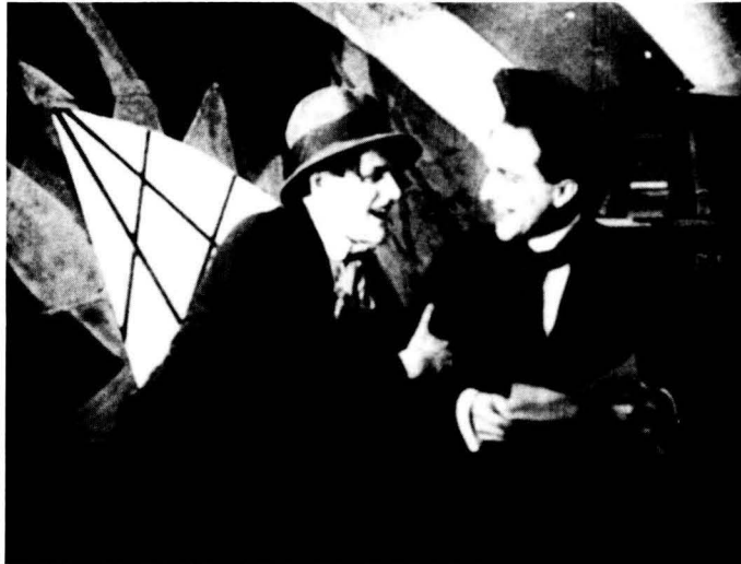
Das Kabinet des Dr. Caligari, de Robert Wiene. El cinema i les avantguardes artístiques van trobar-se el primer terç del segle XX.

terària, El viatge a la lluna , de Jules Verne, el 1902. L'altre responsable destacat del vagó de la ficció va ser, als Estats Units, David Wark Griffith, que es va preocupar de trobar i treballar un llenguatge propi, més enllà de l'estatisme heretat de la fotografia i de la posició de l'espectador respecte a l'escena en el teatre.