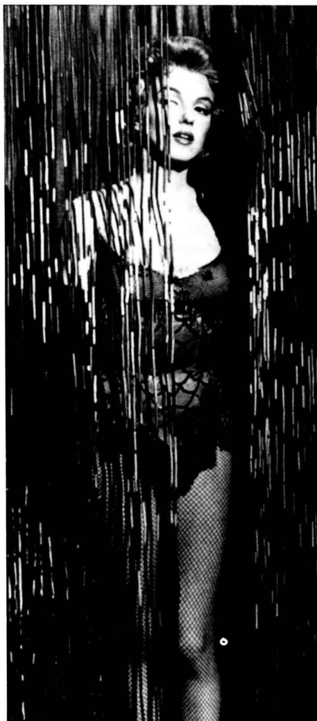
Marilyn Monroe. El cinema ha tingut un dels seus pilars en la construcció de mites.

Quan la cosa semblava que tornava a anar bé, un nou mitjà va posar un pal a les rodes de la locomotora: la televisió, que va ser durant uns anys una feroç competència per al cinema. Aquest, en esclatar, va ser sobretot un problema en ter-