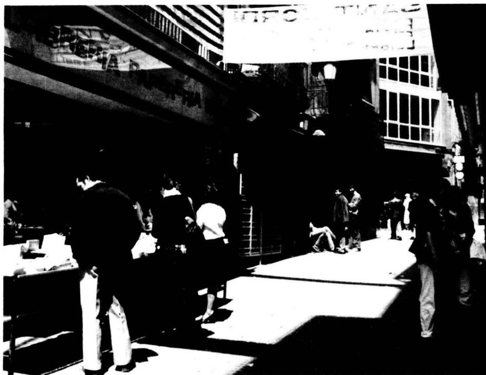
Sant Jordi 1982: llibres, roses i L'EROL 1. La llibreria d'aquesta imatge va tancar uns anys després; això va suposar la pèrdua d'un equipament cultural.

Els desequilibris també són evidents en les nostres indústries de la cultura, i això més enllà de la qüestió de la llengua. Al costat d'alguns sectors clarament normalitzats, n'hi ha d'altres que s'han estancat o fins i tot han fet passos enrere. Dos exemples seran suficients per explicar-ho: primer, el cas de