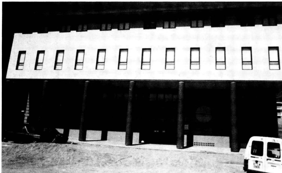
El Mapa de Lectura Pública encara és un pla fantasmagòric que corre pels despatxos. Falta encara una xarxa completa i homogènia de biblioteques. Biblioteca popular Ramon Vinyes, Berga

Hem progressat molt i, certament, la situació s'ha normalitzat en un grau apreciable. Però el camí que encara ens queda per recórrer és molt llarg i molt ample i exigirà de les nostres administracions una voluntat política molt més activa i decidida que no pas la que hem conegut fins ara. No voldria semblar massa pragmàtic ni massa