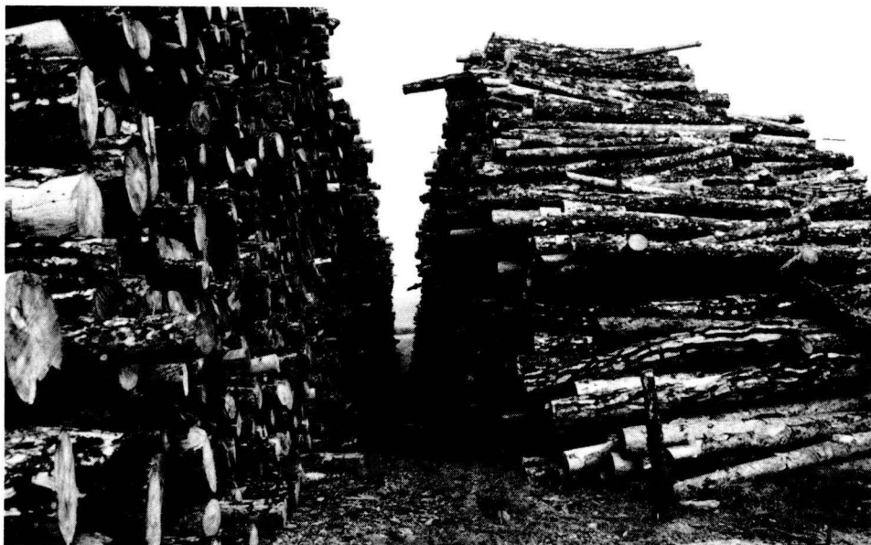
Rengleres de fusta del Lledó de Puig-reig