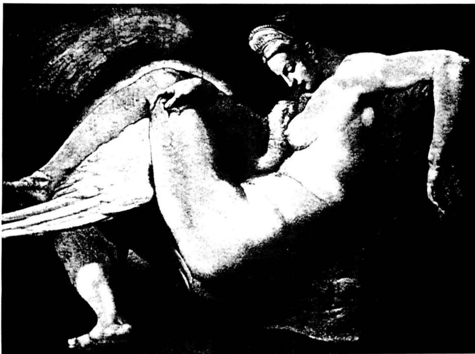
"Leda i el cigne", de Miquel Àngel, temàtica que fa referència a la zoofília. Leda va ser amada per Zeus que la va posseir sota la forma de cigne.