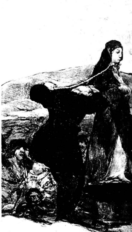
Execució d'una bruixa. 1810. Pinacoteca Antiga de Munich. GOYA

En qualsevol cas, sempre fem referència a zones rurals, akelarres nocturns amb una evident dimensió sexual, a curanderisme i, en alguns processos, possiblement a avortaments.