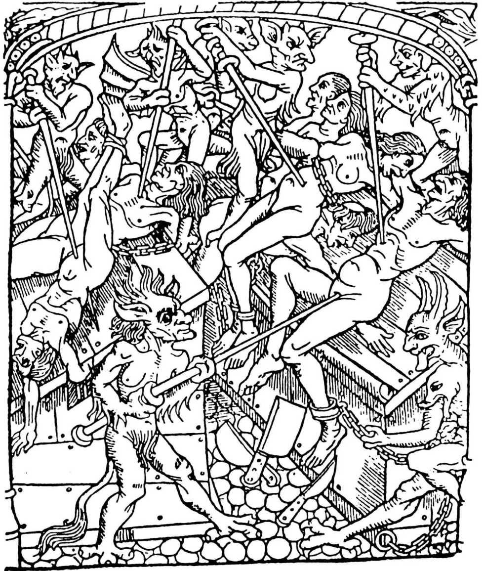
A partir del Concili de Trento, l'església va esmerçar molts esforços en reprimir la sexualitat de l'època. En aquest antic gravat hom pot veure com es presentava el càstig etern dels pecats del sexe.

Kraemer i Sprenger, dominics alemanys, van escriure l'any 1486 el Malleus Maleficarum , un manual que, equiparant bruixeria i heretgia, servia per descobrir i interrogar els suspects de bruixeria. Bruixes i heretges serien turmentats i sotmesos a les mateixes preguntes i donarien les mateixes respostes; serien també cremats a les mateixes fogueres, forma cruel d'executar la pena capital a aquells païssos. A tot Europa es barrejava ja la