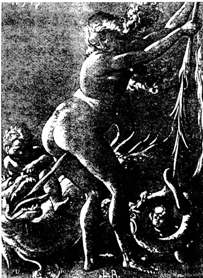
Gravat al·lusiú a la bruixeria i les seves pràctiques.

El tema de l'existència del que en diem sàbat o akelarre, no resta pas tancat. Cohn també considera que es tracta, sim-