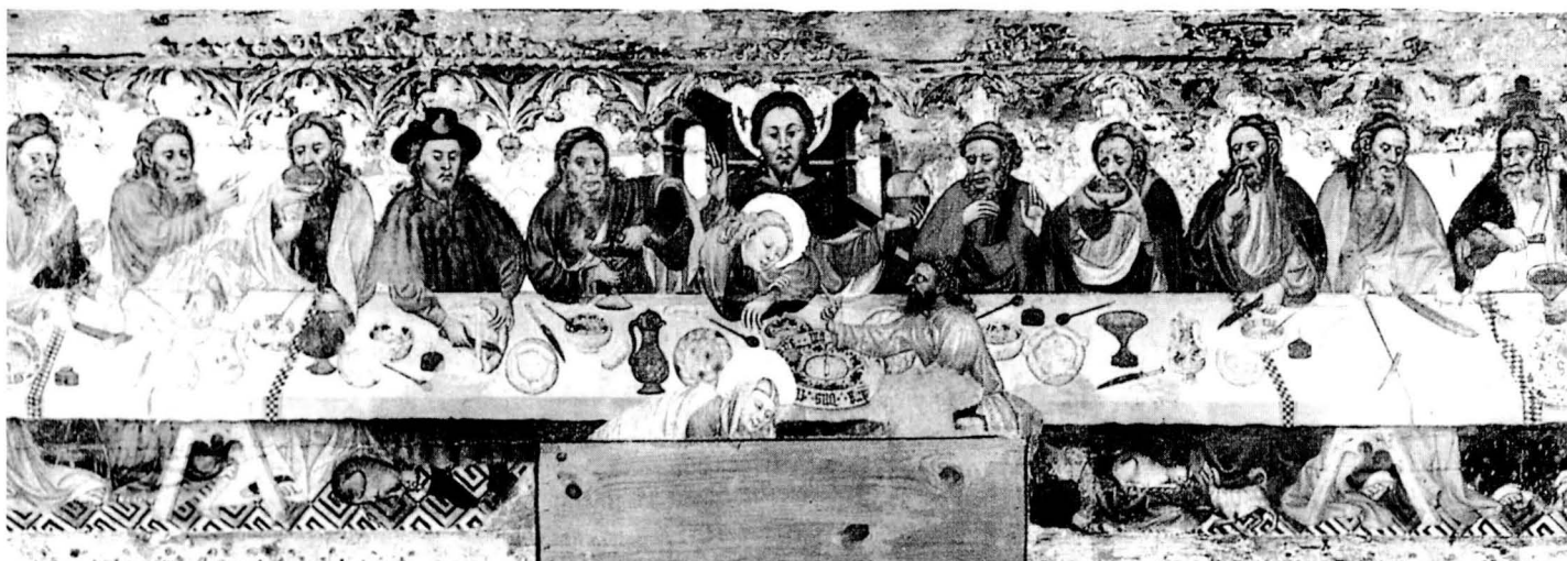
El Sant Sopar, retaule de Jaume Ferrer I (s. XV).