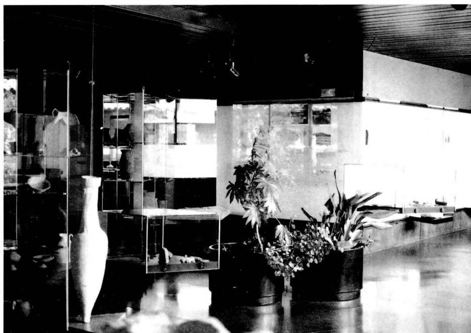
Interior del museu.

La creació del museu, com dèiem, va ser obra del bisbe Ramon Riu i Cabanes, i les primeres obres foren depositades en un noble edifici que aleshores servia de seminari, però que abans havia estat