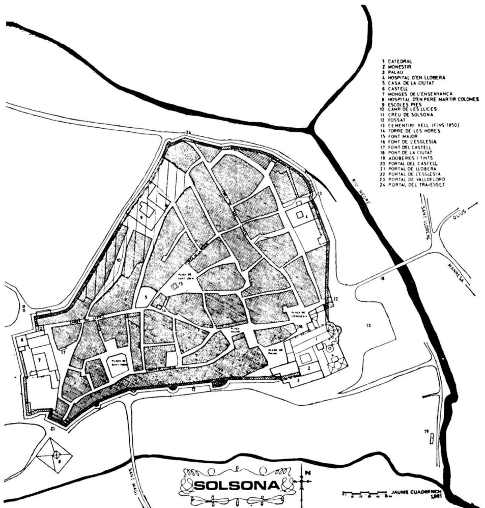
Plànol de la ciutat de Solsona el s. XIX, reclosa dins de les muralles.

natge per conèixer el memorial de Manresa i de Balaguer... Finalment, el 19 de març de 1590, Felip II demana a Roma la creació del bisbat. En la carta que envia al seu ambaixador, escriu que elegix «Solsona como la más cómoda y conveniente de todas las demás (Balaguer o Manresa) por las causas y razones que se contiene en papel que desto trata». Però aquest «papel» no s'ha conegut mai i, per tant, tampoc les raons que el rei exposava.