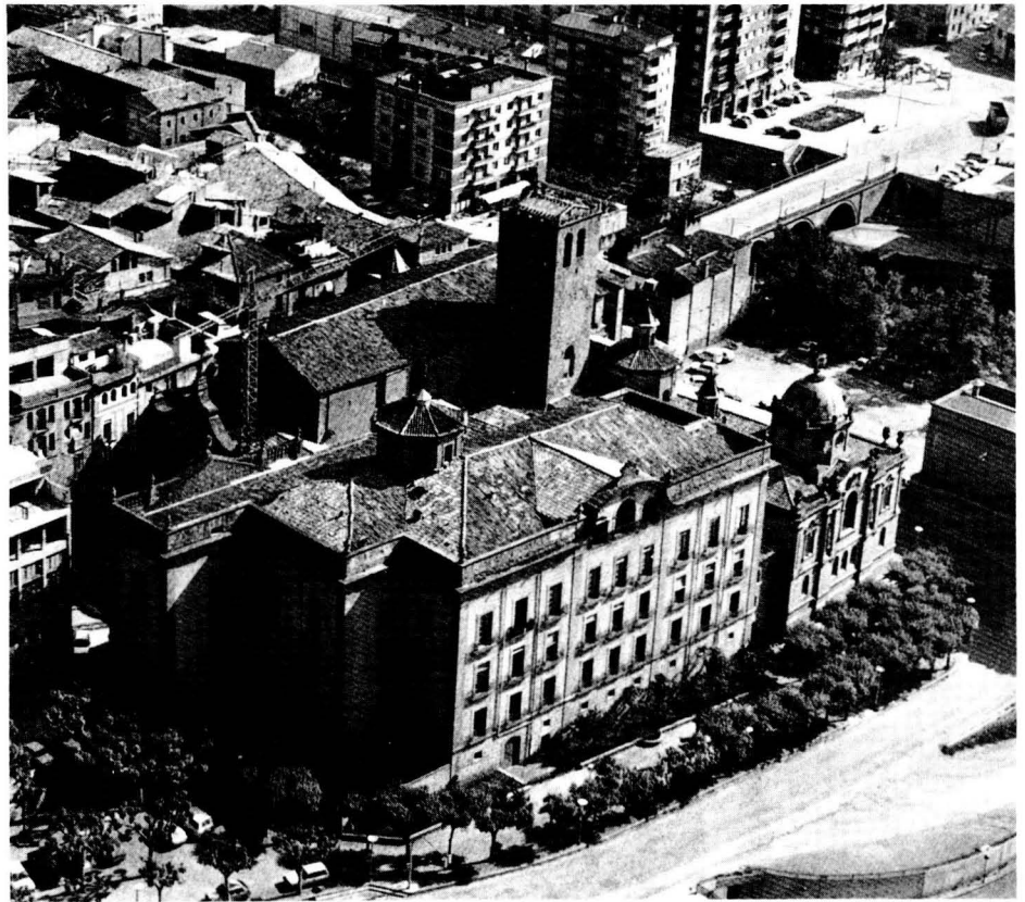
Vista general del palau episcopal i de la catedral.

Si la contenció de l'expansió políticoreligiosa del protestantisme va justificar la creació del bisbat de Solsona, en justifica actualment la continuïtat la necessitat que Solsona i bisbat continuïn aportant respostes i testimonis vàlids, enmig d'un món mancat d'il·lusions i esperances. ✦