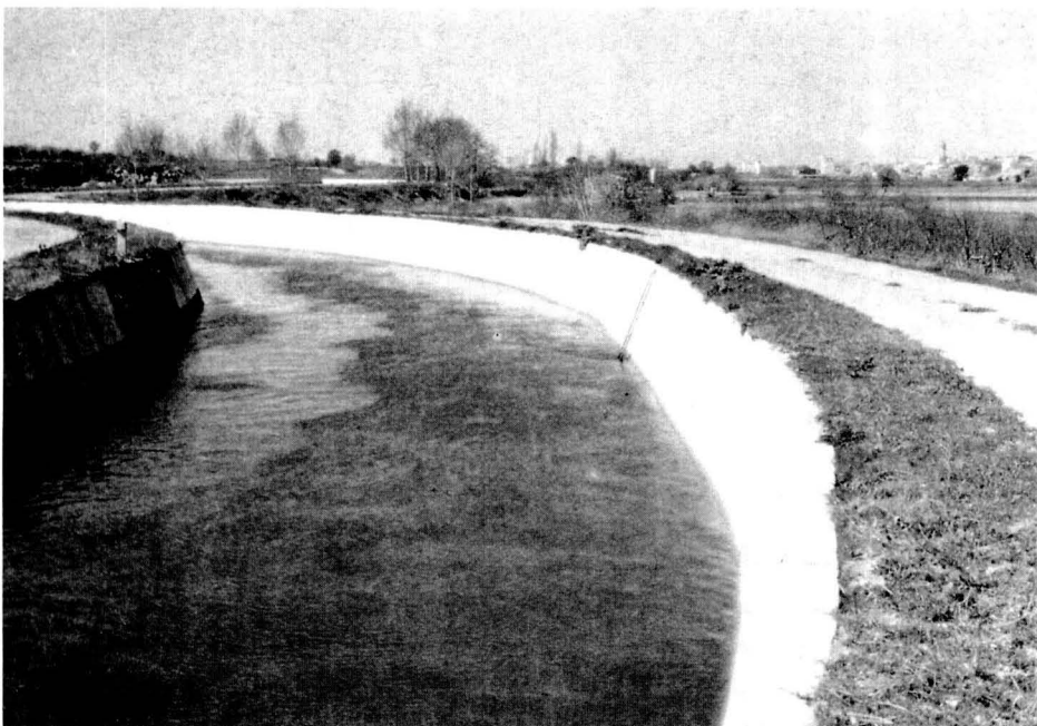
El canal d'Urgell.

Sens dubte el rei es va decidir per Solsona per la seva posició geogràfica, i sobretot perquè la ciutat, aleshores encara només una vila, era al lloc més pacífic, aïllat i a propòsit per ésser una