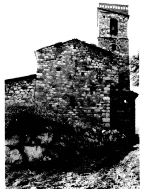
Sibil·la de Berga feu deixes a moltes esglésies, per exemple a Sta. Cecília de Figols. LUIGI

Les deixes que fa al Berguedà són: Sta. Eulàlia de Berga (10 sous), al capítol