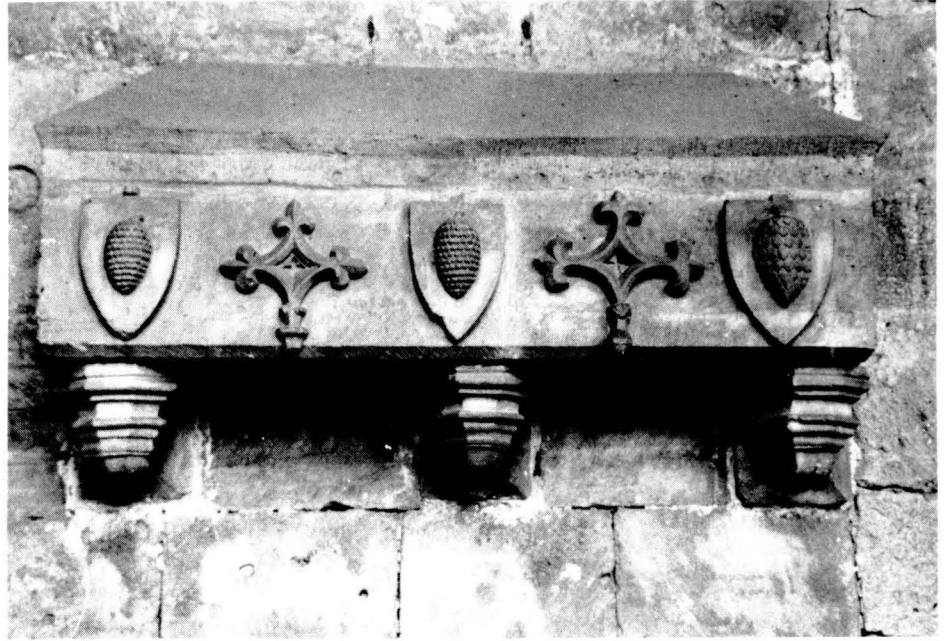
La noblesa local escollia els grans monestirs per enterrar-se. Sepulcre dels Pinós conservat al monestir de Stes. Creus.

Sibil·la deixa en el seu testament a Pere de Berga: el palau de Berga, les dues terceres parts dels drets que perce-