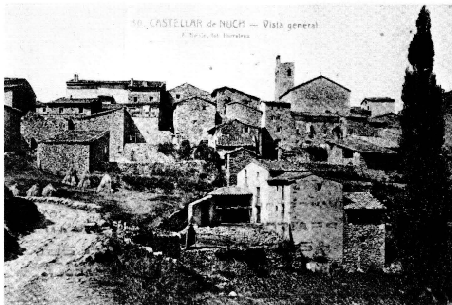
Vista general de Castellar de N'Hug.

Cèsar August Torras escrivia, abans de les normes ortogràfiques, « Castellar de N'Huch ». A l' Àlbum Meravella , llegim « Castellar d'en Huc ». I al Diccionari nomenclàtor vigent: « Castellar de N'Hug ». La diversitat no és prou per deixar d'entendre que totes tres formes denoten la constància, en el topònim, del nom personal Hug; nom que, com sabem, és força propi de la família dels Mataplana, senyora que fou del paratge. Val a dir que el criteri d'haver estat un Hug de Mataplana el nominal batejador del poble no sembla pas compartit pels autors que, com Cels Gomis –en la Geografia General de Catalunya , dirigida per Carreras i Candi–, van escriure, amb anterioritat a la reforma ortogràfica, « Castellar de Nuch »; diríem que no hi veien pas, en Nuch, l'aglutinació del