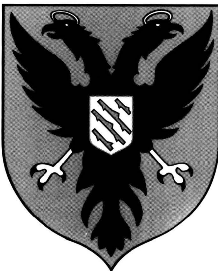
Escut de la baronia de Mataplana.