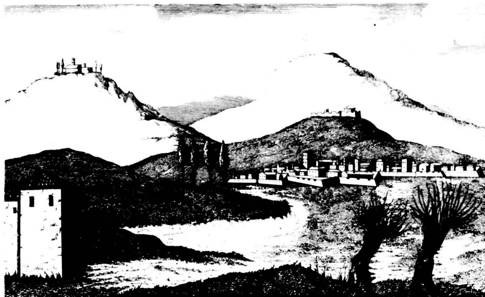
Gravat de la ciutat de Berga, al segle XVIII.