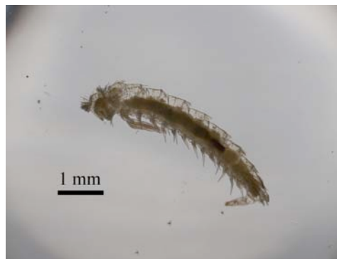
Fig 1. Vista lateral de Phryssonotus platycephalus .

Clase DIPLOPODA de Blainville in Gervais, 1844 Subclase PENICILLATA Latreille, 1825 Orden POLYXENIDA Verhoeff, 1934